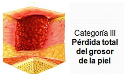
Figura III. Clasificación de la NPUAP/EPUAP de las úlceras por presión. Categoría III (11)