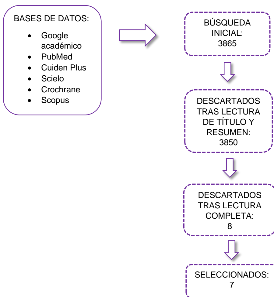
Figura V. Diagrama- Resumen de resultados de búsqueda bibliográfica.