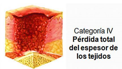
Figura IV. Clasificación de la NPUAP/EPUAP de las úlceras por presión. Categoría IV (11)