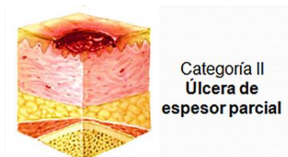
Figura II. Clasificación de la NPUAP/EPUAP de las úlceras por presión. Categoría II (11)