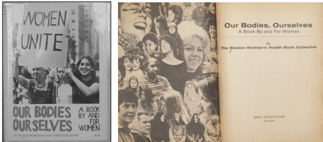
Figura 1 y 2: Portada y primera página de "Our Bodies, our selves" 1973.

Por otro, Carol Downer, del grupo NOW en Los Ángeles, creó en 1971 uno de los métodos más utilizados en los grupos de autoconocimiento: la autoexploración del cuello del útero y del cérvix con un espéculo (Morgen, 2002, págs. 7-8). Poco después Lorraine Rothman, también perteneciente a NOW, empezó a trabajar en el método de extracción menstrual, que consistía en extraer el tejido embrionario que, en caso de embarazo, impedía que este se siguiera desarrollando. Ambas mujeres comenzaron a viajar por EE. UU. exponiendo sus métodos.