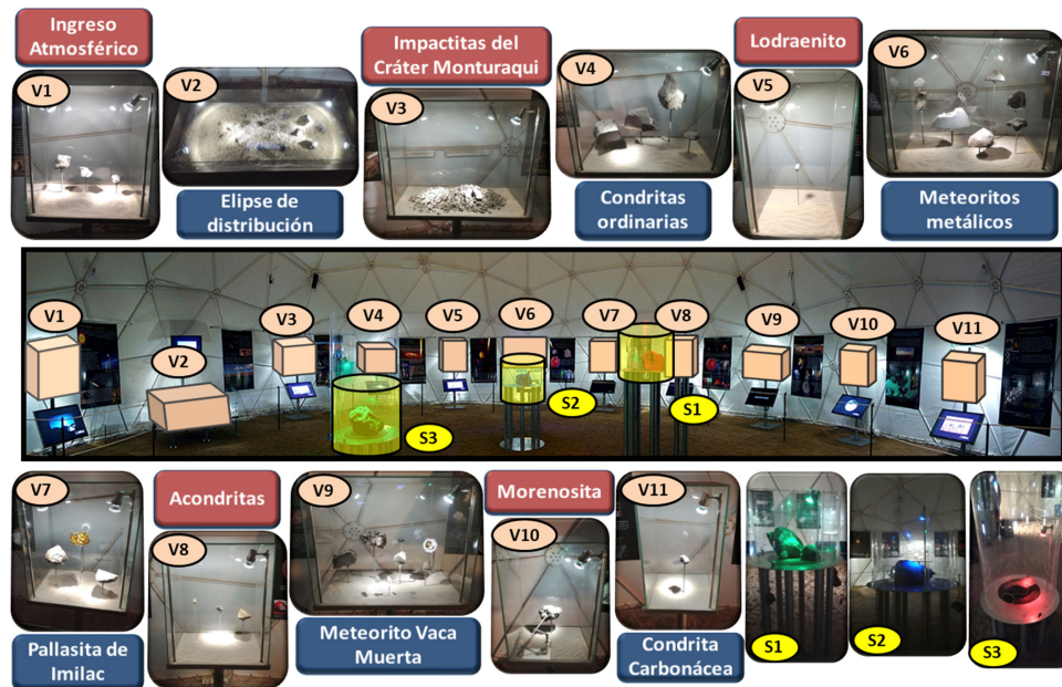
Figura 2. Domo de exposición compuesto de 11 vitrinas en el área audiovisual (rosado) y 3 vitrinas en el área interactiva (amarillo). En la parte superior e inferior se muestra un acercamiento de las vitrinas con el principal concepto asociado. Lo mismo para las 3 vitrinas sensoriales en el costado inferior derecho.

El edificio museográfico se compone de un domo recepción y un domo exposición, con 6 y 12 metros de diámetro respectivamente (Figura 1a). El recorrido comienza con la exposición audiovisual, la cual cuenta con variadas herramientas de apoyo comunicativo (Figura 1b), seguida del área sensorial (Figura 1c) la cual es dirigida por un monitor que orienta de manera lúdica sobre el reconocimiento de meteoritos. Esta etapa es empleada para consolidar de manera práctica los conceptos adquiridos en la exposición audiovisual.