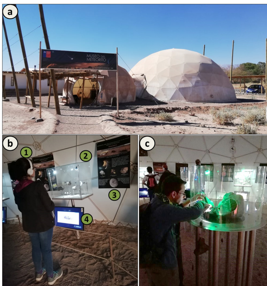
Figura 1. Edificio museográfico del MMC, a) domo recepción (izquierda) y exposición (derecha) b) área audiovisual apoyado de las herramientas: audioguía (1); vitrina de exposición (2); paneles informativos (3) y pantalla LCD (4). En c) se muestra un visitante y el monitor en el área sensorial dentro del domo exposición.

Previo a la formación del MMC, los hermanos Martínez comenzaron con el redescubrimiento de “famosos” meteoritos descritos por naturalistas extranjeros que llegaron a Chile en el siglo XX. Estos hallazgos junto a la definición de la primera zona de alta densidad de meteoritos en el DA, Pampa (Zolensky, Martínez & Martínez de los Ríos, 1995), contribuyeron al incipiente desarrollo de la ciencia meteorítica en Chile.