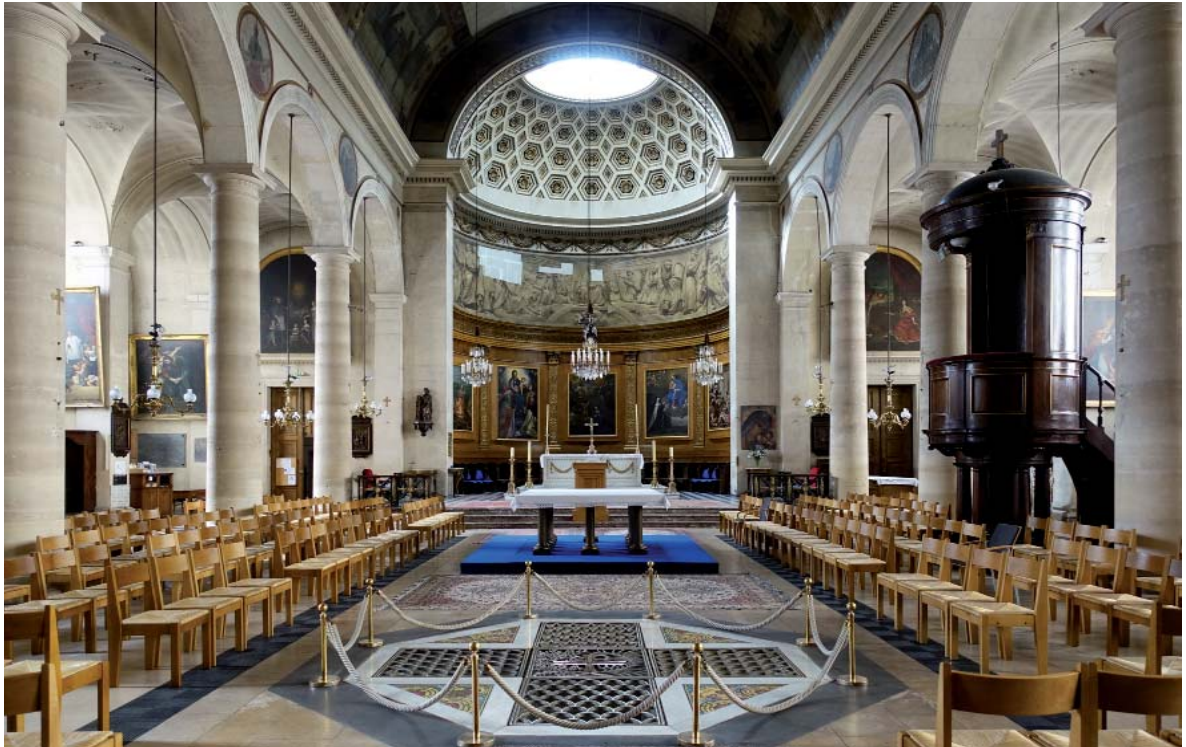
Fig. 06. Adecuación litúrgica de la iglesia de Notre-Dame-de-Bonne-Nouvelle (Étienne-Hippolyte Godde, 1823-30), París (Francia), 1979.

espacio aparece enmoquetado en rojo, una práctica habitual en las iglesias intervenidas.