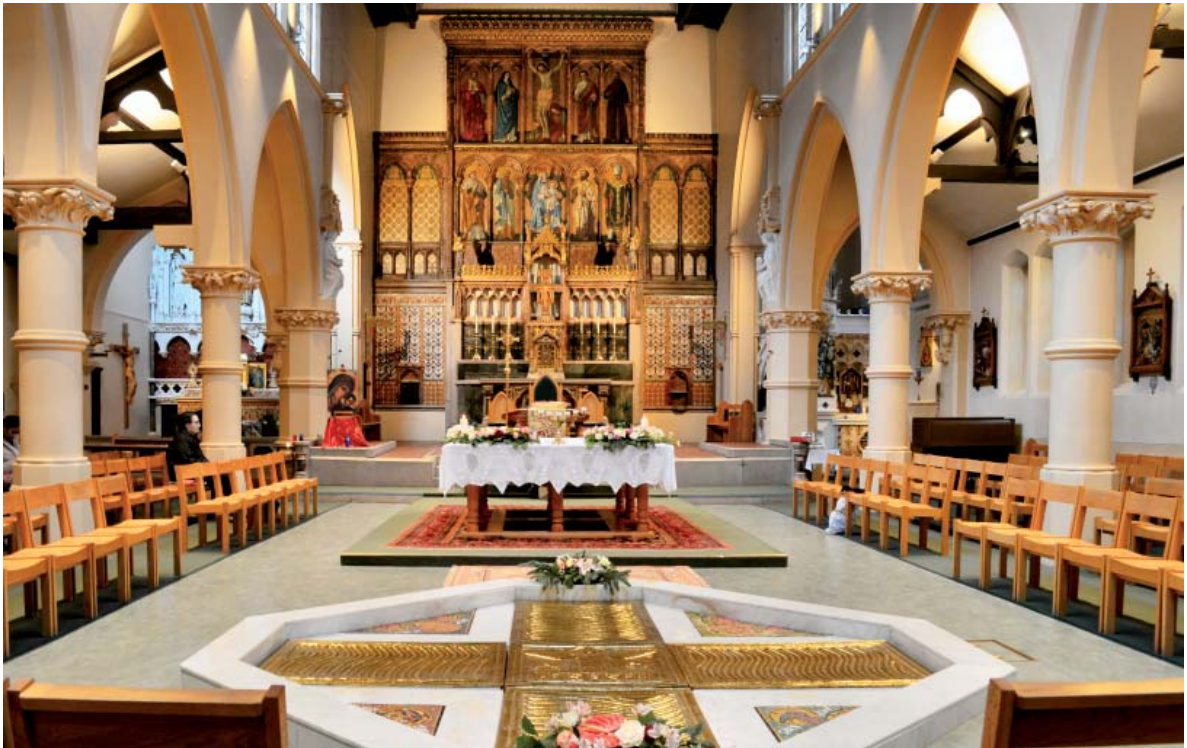
Fig. 05. Mattia del Prete y Antonio Incognito, adecuación litúrgica de la iglesia de San Carlos Borromeo (Samuel J. Nicholl, 1862-63), Londres (Reino Unido), 1978-80.

neocatecumenal. La finalización de las obras de San Bartolomeo in Tuto y proyectos como Santa Catalina Labouré (Madrid) o la Domus Galilaeae (Israel), de gran repercusión en el seno de este itinerario, proveen de una serie de modelos específicos tanto para los focos celebrativos como para el ajuar litúrgico que se van a incorporar tanto en iglesias parroquiales como en espacios polivalentes, muy diversos en cuanto a su estilo y época de construcción.