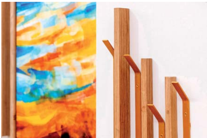
Fig. 06. T113-Taller de Arquitectura. Reforma de la iglesia de la Compañía de María, Burdeos (Francia), 2019; imagen del anteproyecto.