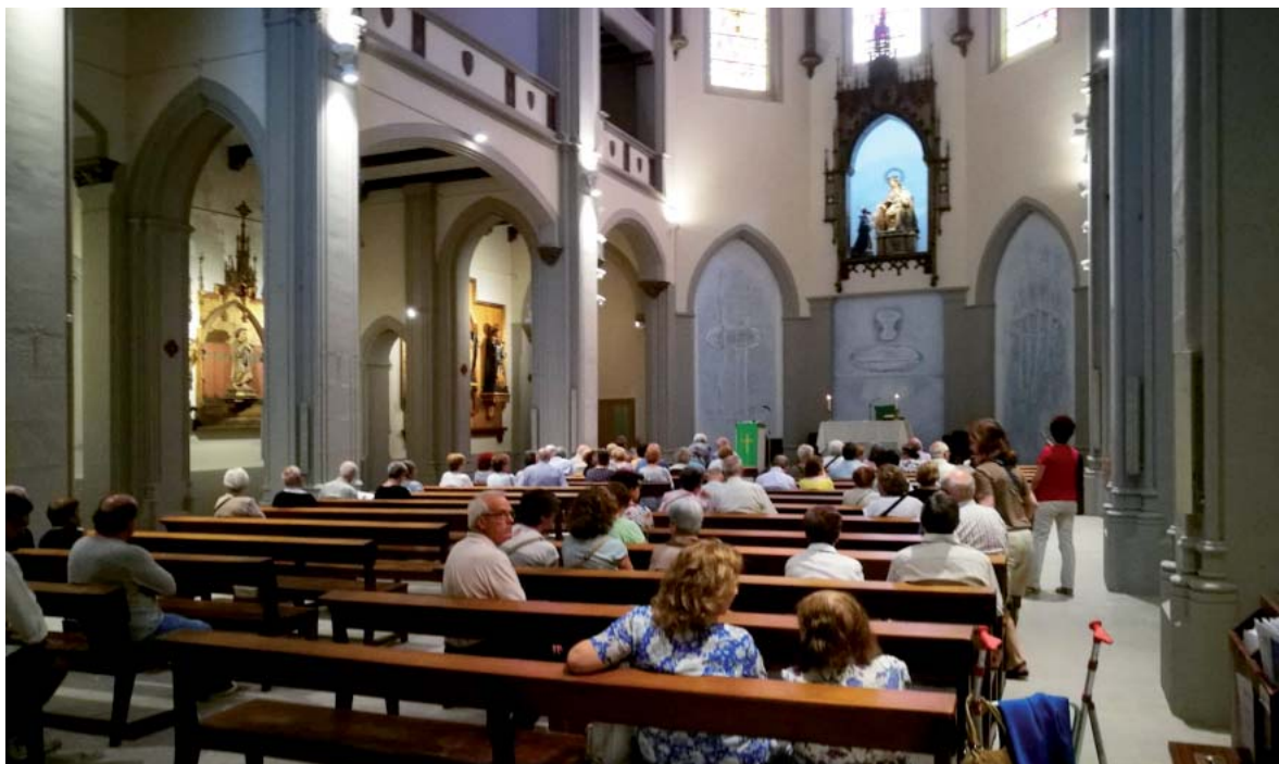
Fig. 11. T113-Taller de Arquitectura. Reforma de la iglesia de la Mare de Déu del Roser (padres Dominicos), Barcelona, 2018.

Ahora bien, la experiencia proyectual nos ha llevado a caer en la cuenta de que ésta no puede ser tomada tan solo como un conjunto normativo, sino que es también una invitación al juego creativo que le es inherente y que, al mismo tiempo, dialoga constantemente con las características de los hombres y comunidades contemporáneas; ya sea éste un diálogo con las fuentes bíblicas, los carismas eclesiales, los ritos, la tecnología o la imaginación de la actividad pastoral que desea comunicar una Buena Nueva para hoy.