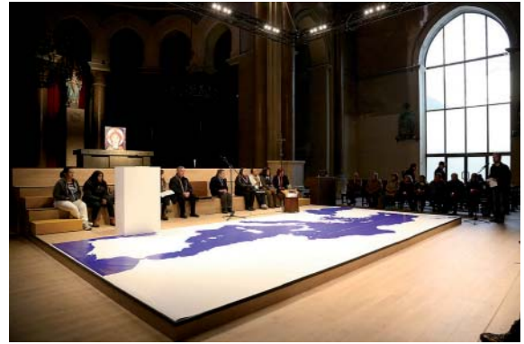
Fig. 01. T113-Taller de Arquitectura. Templo de Santa Madrona, Poble-Sec-Barcelona, 2014; celebración eucarística. Fig. 02. Oración comunitaria sobre la inmigración en la misma iglesia.