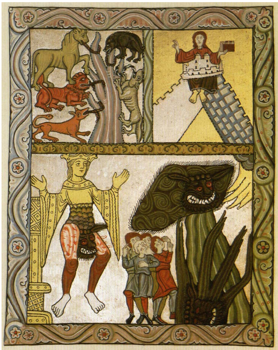
Fig. 3. Wiesbaden, Hochschul- und Landesbibliothek RheinMain, Hs. 1 (Scivias III, 11).