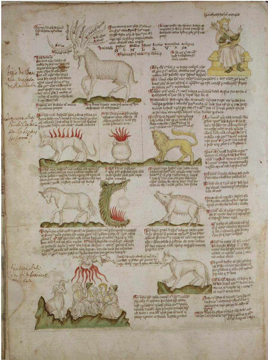
Fig. 2. Roma, Biblioteca Casanatense, cod. 1404, f. 31v.