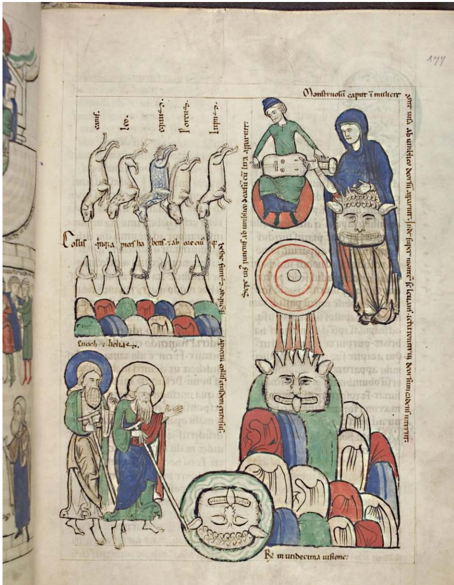
Fig. 4. Heidelberg, Universitätsbibliothek, cod. Sal. X, f. 177r (Scivias III, 11).