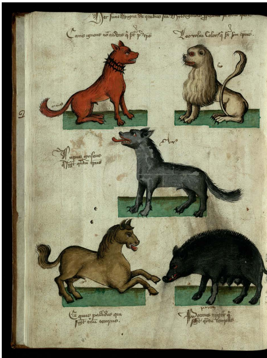
Fig. 5. Cambridge, Trinity College Library, 360, f. 41v.