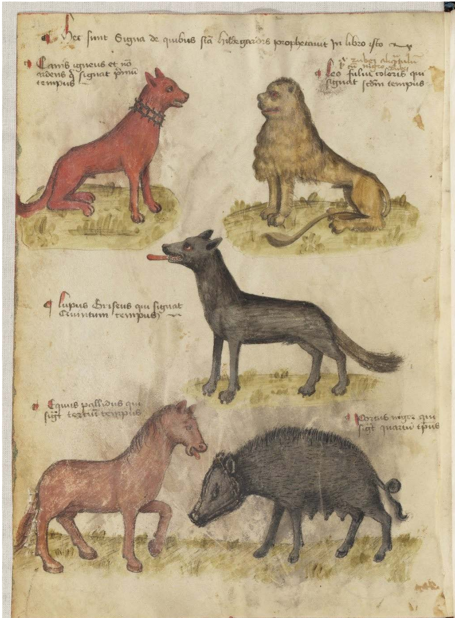
Fig. 6. Paris, Bibliothèque de l'Arsenal, cod. 212, f. 11v.