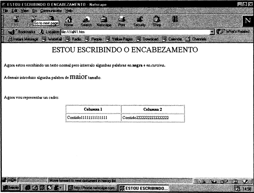
Fig. 3: Imaxe do texto lido usando Netscape

Así pois, o contido dunha páxina web é un texto con marcas HTML que indican o formato que o texto debe ter. Porén, o que os usuarios ven, ao se conectaren mediante o seu navegador á páxina web en cuestión, é o texto xa axeitadamente formatado, sen visualizaren as marcas de formato. Isto quer dicir que todo navegador da Internet le, entende e interpreta as marcas HTML e formata os textos segundo o indicado nas mesmas.