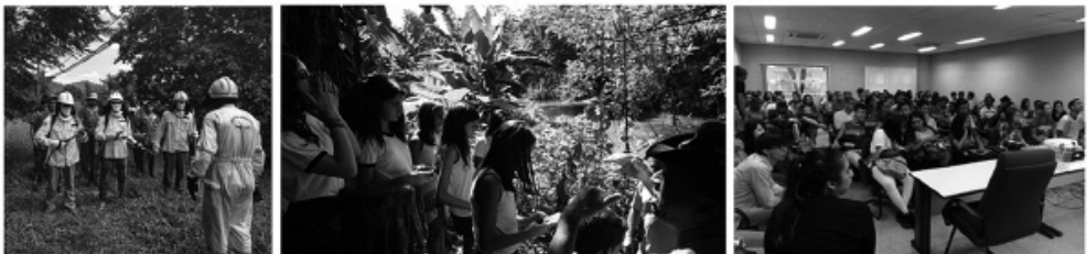
Figura 4: O Campus como espaço privilegiado para realização de diferentes atividades educativas, a promover a aproximação das escolas no seu entorno com outras partes interessadas na conservação.

ter um objetivo muito claro na conservação da biodiversidade, e para isso, para nós, por conta da inserção do Inmetro na sub-bacia do Saracuruna, é de grande importância o alinhamento das nossas iniciativas com os ODS 06 água e saneamento e ODS 15 vida terrestre. Também, que o engajamento da alta administração é uma consequência da visibilidade interna e externa que se consegue dar para os problemas, levando em conta que existem questões que se consegue omitir, mas que não se consegue negar. E ainda, que é muito mais fácil trabalhar de forma colaborativa do que isoladamente e isso tanto vale internamente, na instituição, como externamente, em relação a outras partes interessadas. Neste sentido, vale mencionar que a abordagem mais recente de 'olhar para o lado' não apenas aproximou o Inmetro de colaboradores, apoiadores e parceiros no entorno do Campus, em favor da conservação, como promoveu uma aproximação da equipe de Meio Ambiente e Educação Ambiental com a alta administração, reduzindo as resistências internas ao compromisso da instituição com a melhoria do desempenho ambiental e com a conservação da biodiversidade.