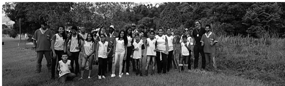
Figura 5: As atividades de educação ambiental, com a participação de alunos de escolas do entorno em iniciativas de melhoria, como a recuperação de sistemas ribeirinhos em áreas da instituição, dão visibilidade para as questões ambientais locais e servem como estímulo para a mudança.

A estratégia adotada pela equipe de Meio Ambiente e Educação Ambiental para a sensibilização dos seus gestores, decorrente do ‘olhar para cima’, se apoia na aproximação com a sociedade, o ‘olhar para o lado’, por meio da participação de alunos das escolas do entorno em atividades educativas e de recuperação ambiental no próprio Campus, articuladas com a Agenda 2030 , com a colaboração, o apoio e a parceria de outras partes interessadas