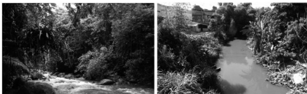
Figura 2: O rio Saracuruna a cerca de 5km à montante e à jusante do Campus do Inmetro: a degradação dos sistemas ribeirinhos é decorrente do lançamento de efluentes sem tratamento, da destinação final inadequada de resíduos e da ocupação irregular de áreas de preservação permanente.

O Campus de Laboratórios do Inmetro, em Xerém, com área de cerca de 180 hectares, no 4º Distrito do município de Duques de Caxias, no estado do Rio de Janeiro, é