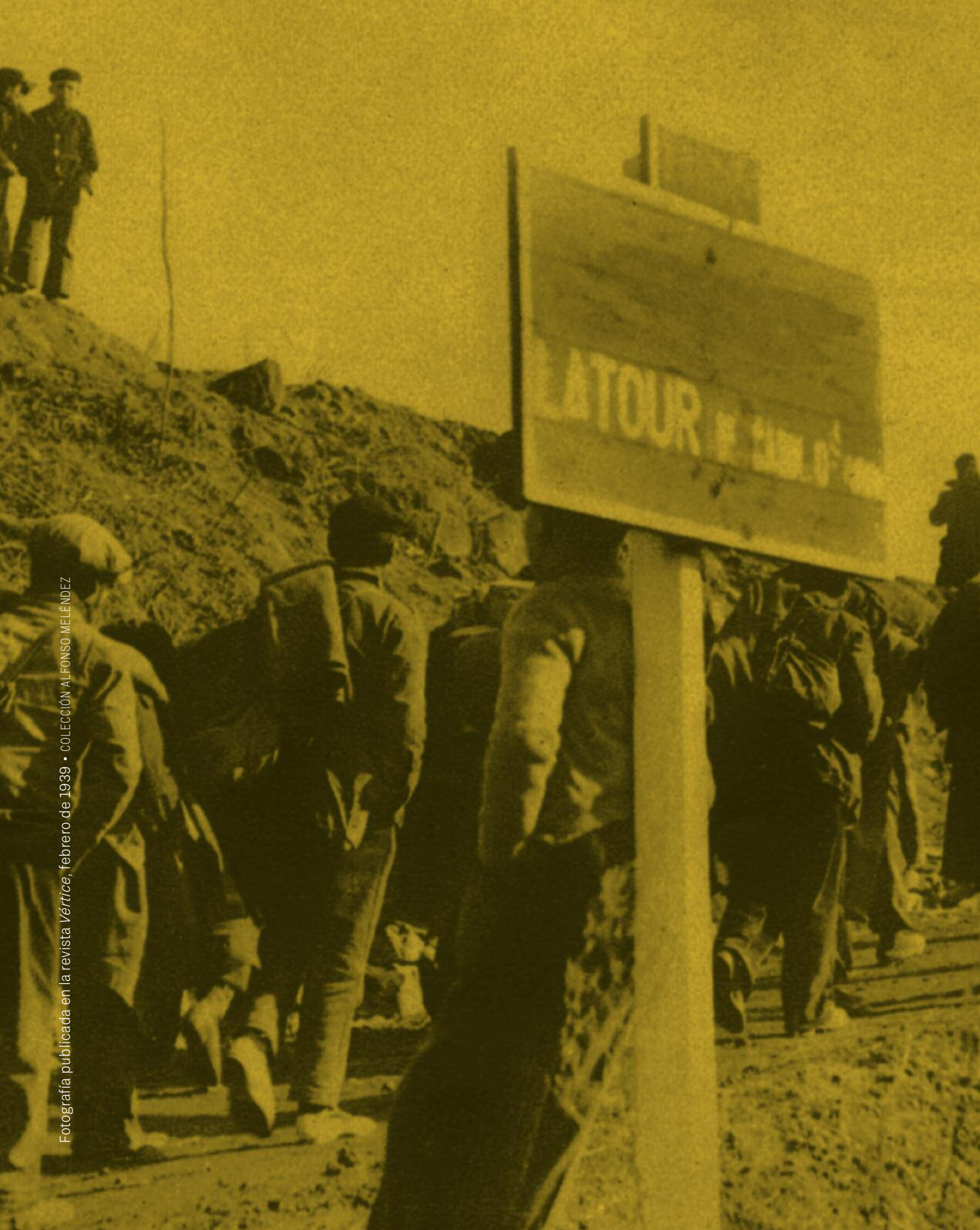
Fotografía publicada en la revista Vértice , febrero de 1939 • COLECCIÓN ALFONSO MELÉNDEZ