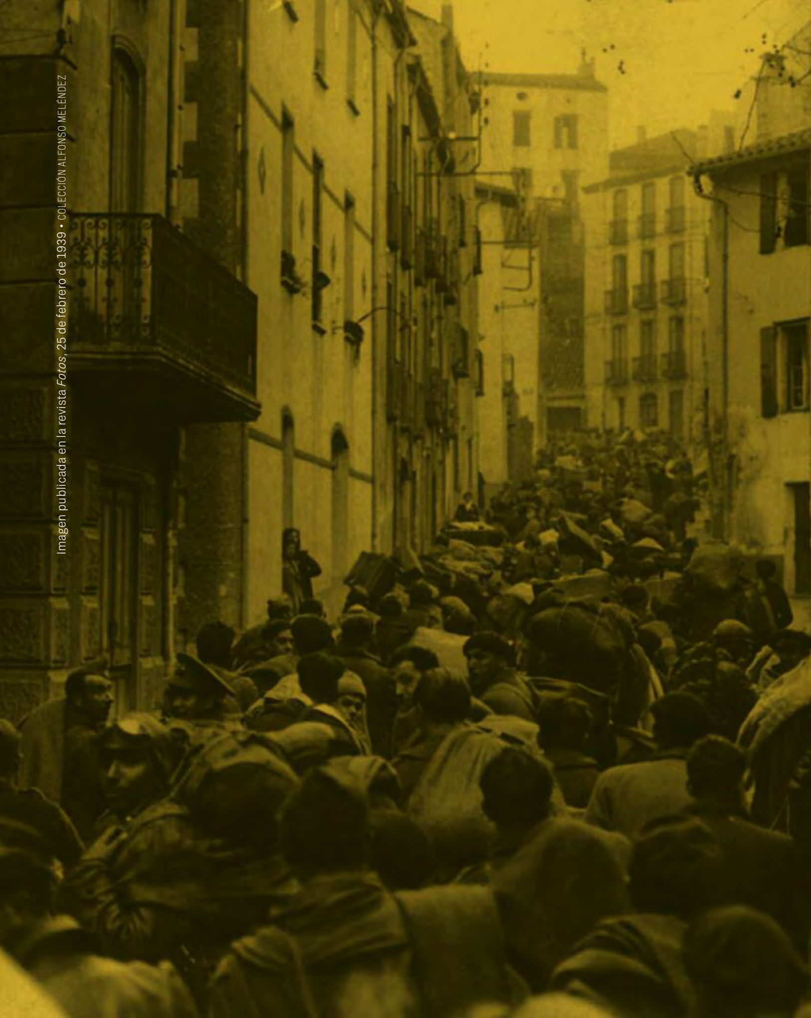
Imagen publicada en la revista Fotos , 25 de febrero de 1939