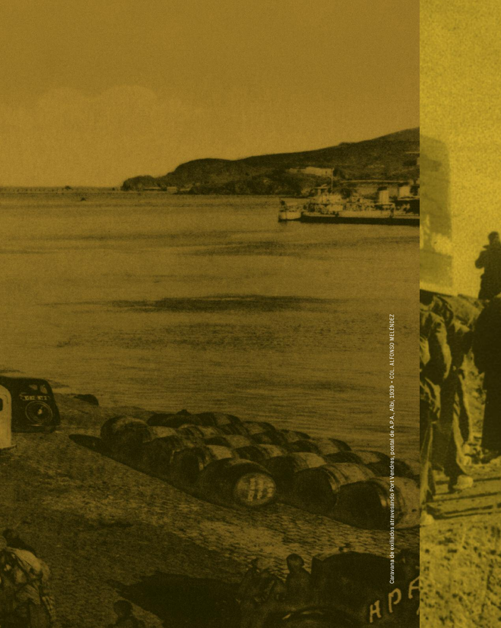
Caravana de exiliados atravesando Port Vendres, postal de A.P.A., Albi, 1939