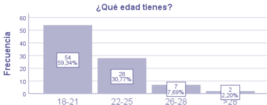
Figura 3: Distribución de encuestados según rangos de edad.

Por otro lado también se valoró la distribución según edad, como se puede observar en la Figura 3 .