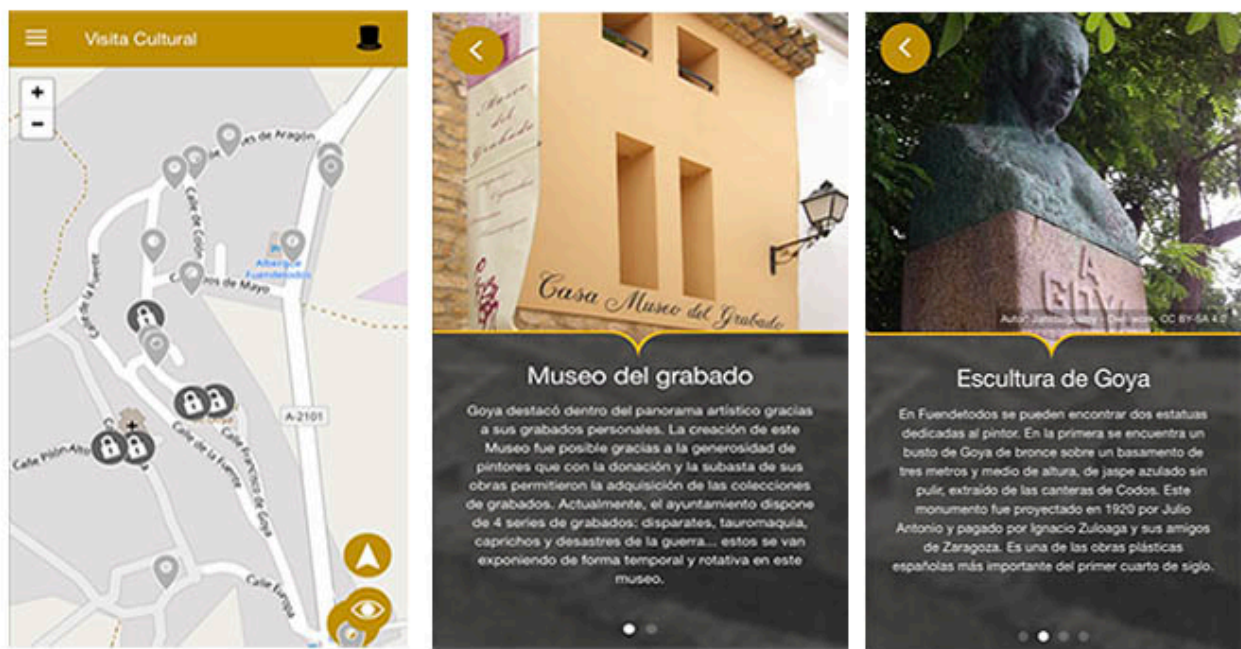
Figura 2. Pantallas de la aplicación para móviles Fuentetodos

La variable tipología utilizada es el itinerario donde el usuario es guiado mediante el recorrido que muestra la app. De este modo, el usuario puede visitar los distintos lugares de interés gracias a los mapas propuestos. El usuario solo es observador y no se produce un aprendizaje activo.