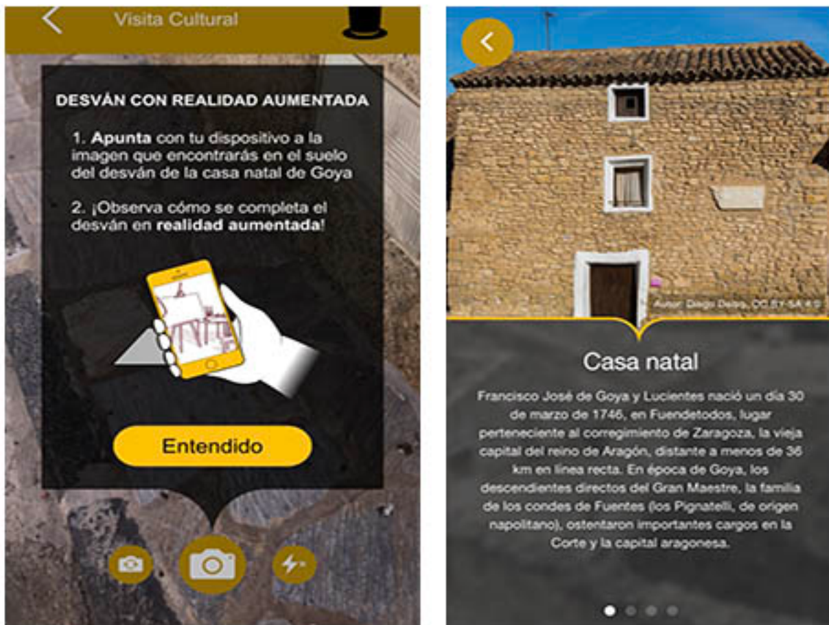
Figura 3. Pantallas de la aplicación para móviles Fuendetodos

llegada del turista al recurso, y complementar la información en el propio destino, aumentando la información visual en la propia visita al bien de interés cultural, y la tecnología de realidad aumentada incorpora un valor añadido a la experiencia del turista gracias a los dispositivos móviles.