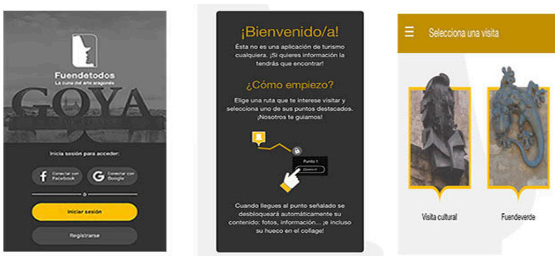
Figura 1. Pantallas de la aplicación para móviles Fuendetodos

En primer lugar, la dimensión descriptiva, puesto que se trata de una aplicación desarrollada por la empresa Imascono Art S.L. y cuenta con el apoyo económico del Consorcio Goya-Fuendetodos y está disponible para Android e IOS, aunque sólo puede activarse una vez que el visitante está en la localidad de Fuendetodos. Se trata de una app gratuita y ocupa 99,7 MB y va dirigida a todo tipo de públicos en general, aunque también hay una parte más lúdica e infantil. Está disponible en castellano, la etiqueta viajes es la que se ha añadido en la store para su descarga.