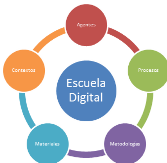
Figura 2. Elementos clave en la creación de la escuela digital. Elaboración propia.

Para conseguir identificar los elementos clave en este proceso se partió de la identificación de las palabras más frecuentes en las entrevistas, utilizando como herramienta el programa Atlas.ti. Posteriormente, se procedió a la agrupación de estas palabras en grandes categorías, emergiendo un total de 5, tal y como se refleja en la Figura 2. Tanto las familias, como el alumnado y el profesorado destacan, en primer lugar, el valor de todos los agentes implicados para la construcción de una escuela digital que permita el desarrollo de la CD. En segundo lugar, señalan la importancia del diseño de los procesos de enseñanza-aprendizaje desde una perspectiva pedagógica clara encaminados a la consecución de la CD. En tercer lugar, poseen una mirada amplia sobre los contextos educativos, que van más allá del centro y el aula. En cuarto lugar, se explicitan las transformaciones que observan en los materiales didácticos, predominantemente digitalizados en los últimos tiempos. Y por último, destacan las metodologías activas implementadas, porque otras prácticas son posibles.