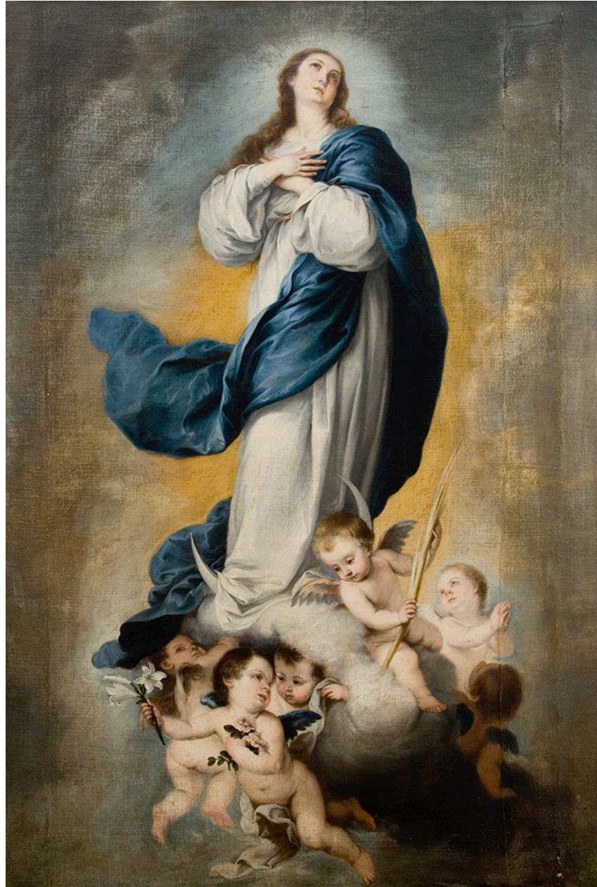
Fig. 2. Inmaculada, de Murillo (c. 1680); Fundación E. Arocena