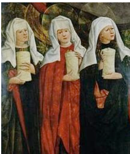
Fig. 3. Detalle de Las Tres Marías en la tumba , de Nicolaus Haberschrack, 1470; Museo Nacional de Cracovia

colectivo, objeto de numerosas representaciones plásticas (fig. 3) es fugazmente evocado (“Tres mujeres, tres varones”, 665, v. 1), pero la escena se desarrolla (y así lo indica la anotación marginal “Madalena va al sepulcro”) con quien repite el gesto de su primera aparición 15 , resaltando el motivo del unguento y desplazando a la figura materna, esencializada en el momento de la expiración: