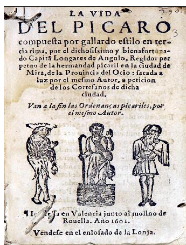
Fig. 2. Edición de Valencia de 1601

Digamos, en primer lugar, que esa fecha de 1607 es imposible, puesto que uno de los testimonios, avalado documentalmente, es un impreso fechado en Valencia en 1601 (Fig. 2) y que no puede ser considerado editio princeps , a la vista de los varios e importantes pasajes omitidos o suprimidos editorialmente y que afectan, entre otras omisiones, a los diez primeros tercetos de la obra, rescatables por cotejo con otros dos documentos fidedignos. Ese mismo impreso valenciano incluye, además, como anónimo, el pasaje que en el Guzmán de Alfarache aparece en la Primera parte con algunas variaciones de enjundia que requieren atención crítica y que implican decisiones editoriales. Tanto el texto de La vida del pícaro como el pasaje del Guzmán se imprimen sin nombre de autor, lo que permite situar la fuente previa de la edición valenciana algún año antes de 1601, previsiblemente dentro del quinquenio inmediatamente anterior a la fecha de la edición anónima valenciana; es decir, en el período 1595-1600.