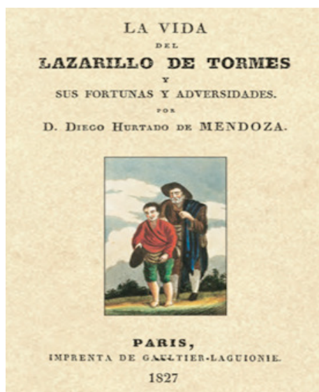
Fig. 3. Cubierta de la edición de Gaultier-Laguionie

Una última cuestión en el apartado de posibles atribuciones es la que atañe al malicioso soneto que acompaña a Vida del pícaro en la edición de Joaquín María Ferrer, de 1827 (Fig. 3), que, según su editor, es “Soneto del mismo autor”. Se recordará que Mateo Alemán termina su primera parte del Guzmán con un soneto supuestamente escrito por Dorido. En ambos casos se trata de sonetos de construcción impecable, aunque ciertamente algo alejados del nivel de Góngora o de Lope (aunque no del nivel de los sonetos de Liñán). Es un soneto procaz y malicioso en cuanto al fondo, pero impecablemente resuelto en lo que atañe a la rima. Ni mejor ni peor en su factura poética que el que cierra la primera parte del Guzmán . Creo que vale la pena conocerlo y situarlo en el cajón de los ‘sonetos atribuidos a’.