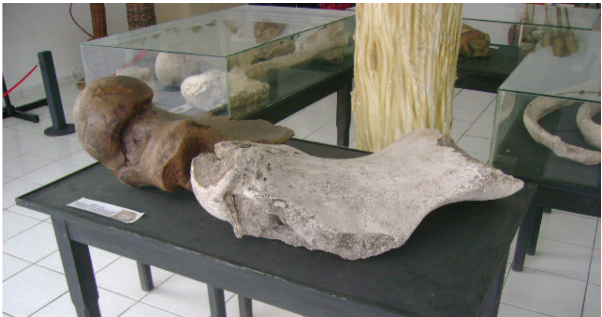
Fig. 9. Restos fósiles (dos ejemplares de fémur) del perezoso-gigante ( Eremotherium laurillardi ) expuestos en el Museu de Pré-História de Itapipoca (MUPHI), município de Itapipoca, Estado de Ceará.