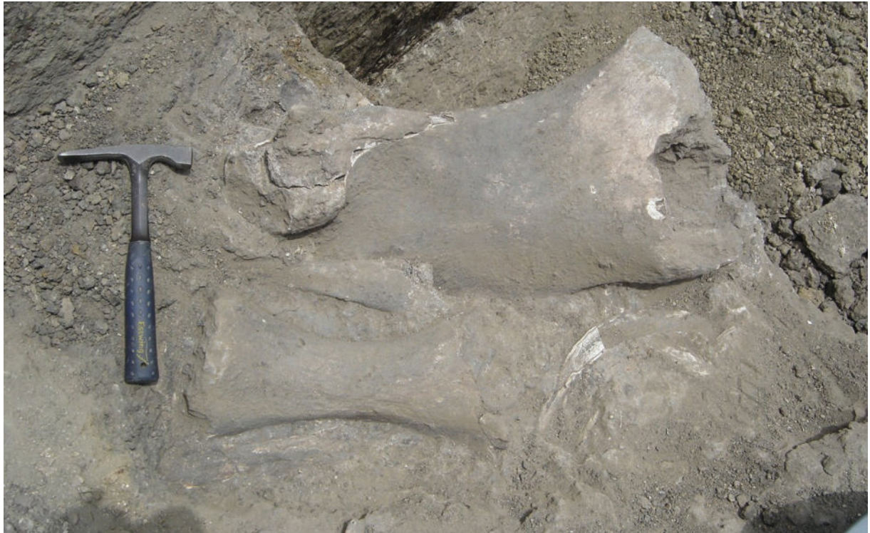
Fig. 8. Restos fósiles (fémur y tibia) de un perezoso-gigante ( Eremotherium laurillardi ) dentro del depósito de un tanque natural. Este tanque es conocido como Jirau 1, y está ubicado en el yacimiento paleontológico Jirau, municipio de Itapipoca, Estado de Ceará. El contenido fosilífero fue recogido en el año 2006 por el Profesor Celso Lira Ximenes.