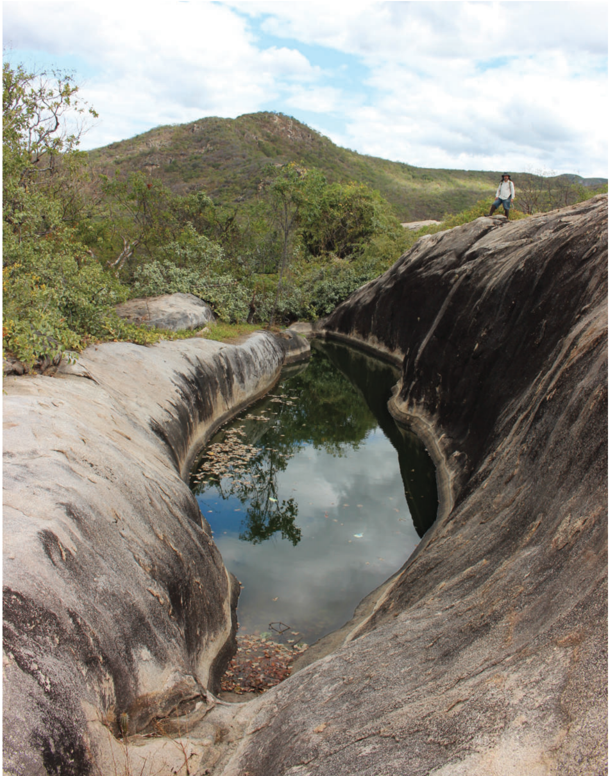
Fig. 5. Tanque natural escarpado de gran profundidad en el Sítio Paleontológico João Cativo, município de Itapipoca, Estado de Ceará. Los tanques naturales han sido utilizados históricamente como reservorios de agua en épocas de sequía en Noreste de Brasil.