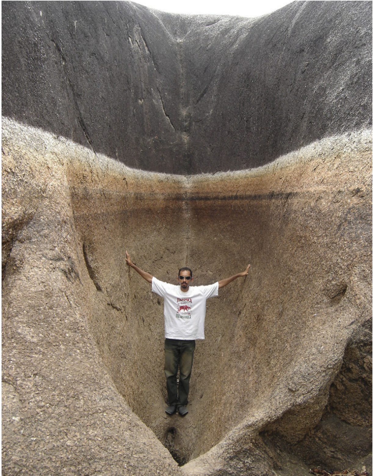
Fig. 6. La parte interna de un tanque natural escarpado de gran profundidad en el Sitio Paleontológico Jirau, municipio de Itapipoca, Estado de Ceará. Es posible notar el control estructural por la fractura-diaclasa y la morfología de fondo cóncavo.