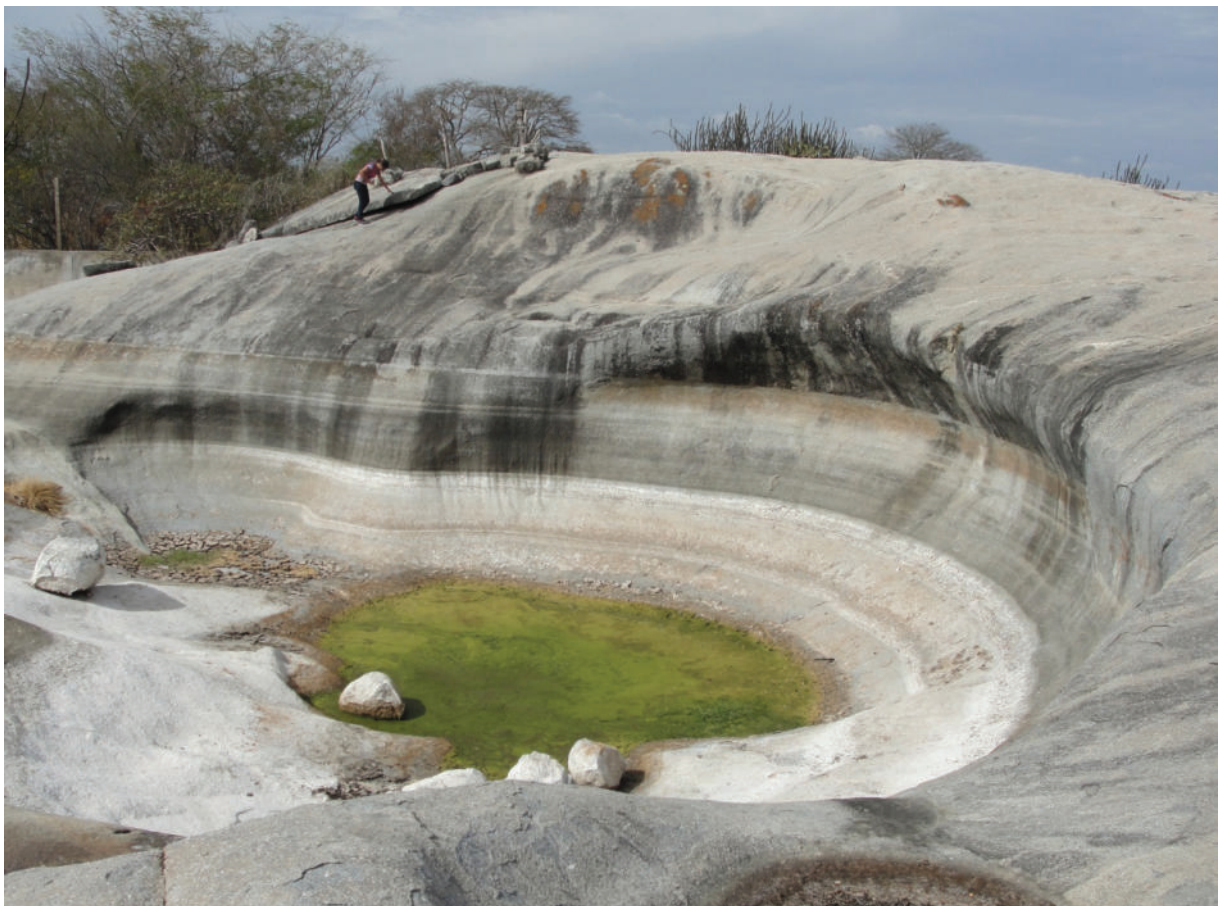
Fig. 3. Tanque natural con paredes escarpadas y con el desarrollo de un exutório a la izquierda de la fotografía. Esta forma se ha desarrollado en el borde de un domo granítico en la localidad de Curimatãs, municipio de Pocinhos, Estado de Paraíba; se aprecia su formación por la coalescencia de cavidades que le dan un aspecto lobulado al tanque.

directa con procesos de corrosión química por debajo del frente de alteración en el contacto suelo-roca. Los tanques naturales pueden ser integrados al modelo polifásico propuesto por VIDAL ROMANÍ (2008), que propone un origen subsuperficial relacionado tentativamente con procesos subedáficos o, más verosíblemente, generados por la migración y concentración de cargas durante la intrusión del granito en la litosfera (VIDAL ROMANÍ, 2008). Posteriormente, estas depresiones iniciadas en profundidad, en condiciones confinantes, quedarán expuestas a los procesos exógenos aunque ya en condiciones subaéreas (Figura 3).