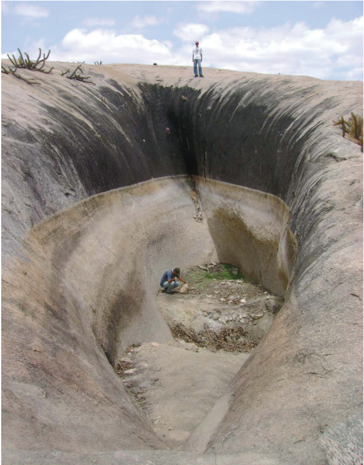
Fig. 4. Tanque natural escarpado de gran profundidad ubicado en el Sitio Paleontológico Lajinhas, municipio de Itapipoca, Estado de Ceará. La fotografía ha sido tomada desde la zona de desagüe de la cavidad (exutorio) lo que da al tanque un aspecto de sillón.