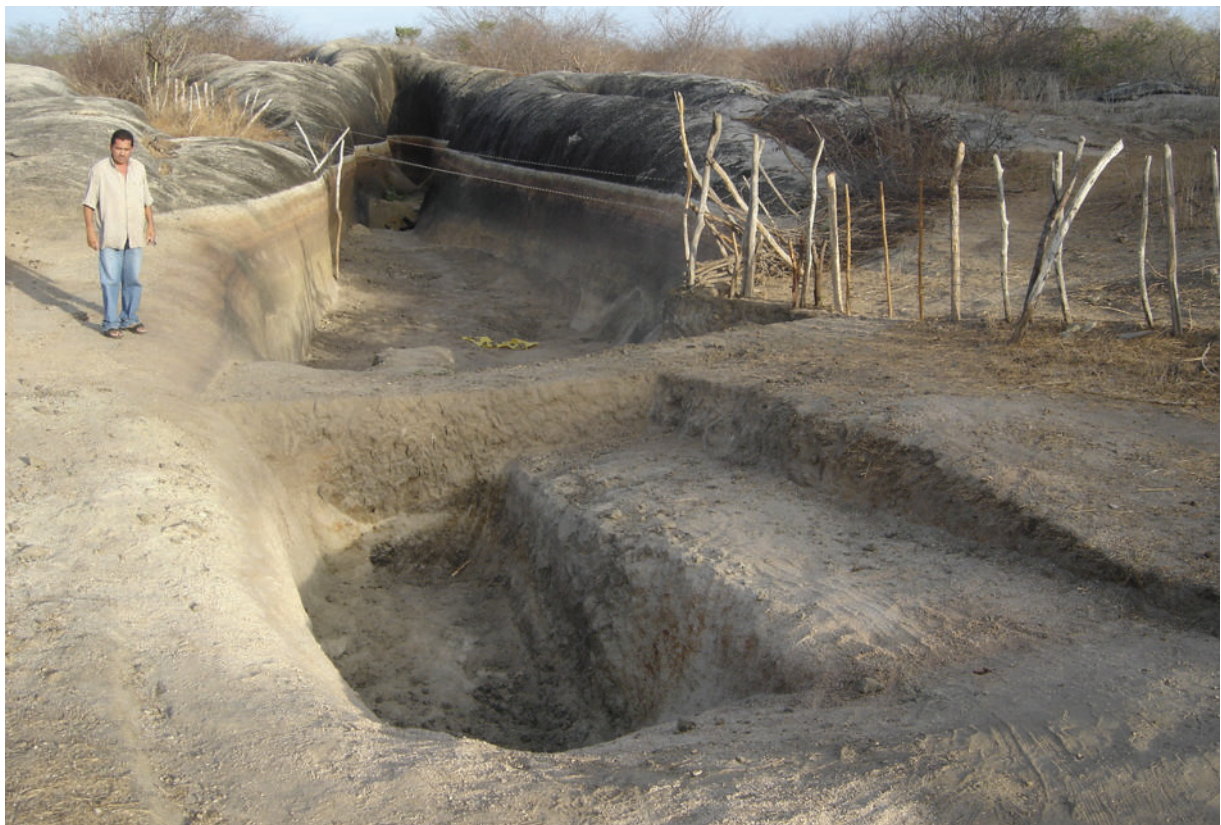
Fig. 7. Proceso de apertura de una cacimba sobre el depósito sedimentario de un tanque natural en el Sítio Paleontológico Jirau, municipio de Itapipoca, Estado de Ceará.

dades asociadas a depósitos paleontológicos de todo Brasil, distribuidas en un área superior a los 800 km 2 sobre el basamento cristalino. Según este autor las condiciones paleoclimáticas fueron favorables para el desarrollo de una fauna diversificada de vertebrados y (ver XIMENES 2009) en Itapipoca se han encontrado más de 30 taxons ya identificados de mamíferos, reptiles, anfibios y aves. En virtud de la concentración de depósitos fosilíferos en los tanques naturales, junto con el abundante material paleontológico recogido y expresiva representatividad de diferentes especies paleomamíferas, el área ubicada entre las drenajes de los ríos Cruxati y Mundaú, en municipio de Itapipoca, se ha llamado también como el “Valle de la Megafauna” (XIMENES, 2003, 2006b, 2009).