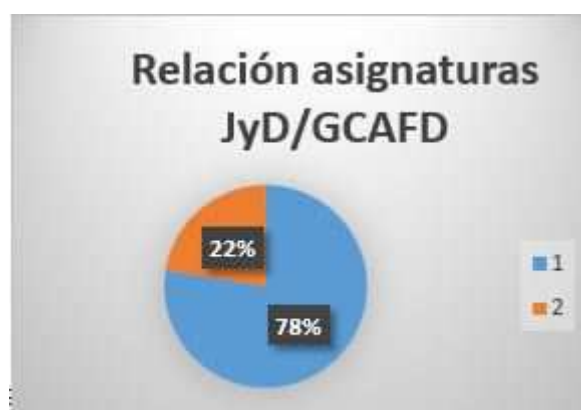
Gráfico 5: Relación asignaturas de Grado con asignaturas optativas relacionadas con el bloque de juegos

Comparando con asignaturas del bloque 3º: Juegos y Deportes, se encuentra que en los planes de estudio se ofertan, entre todas las Universidades andaluzas, 82 materias (22%), de las cuales 37 son obligatorias y 45 optativas. En esta clasificación se incluyen asignaturas como “Fundamentos de los Deportes de Raqueta (Universidad de Sevilla)”, “Perfeccionamiento Deportivo: Balonmano (Universidad de Granada)” o “Enseñanza y Promoción del Voleibol (Universidad de Huelva)”.