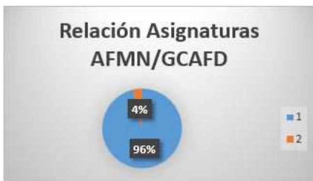
Gráfico 2: Relación asignaturas de Grado con asignaturas obligatorias relacionadas con AFMN

Analizando los planes de estudio publicados en la web de las diferentes universidades públicas andaluzas donde se imparte el Grado en CCAFYD, de las 283 asignaturas que se ofertan solo 28 (9.9%) están relacionadas con la AFMN, de las cuales 17 se ofertan como asignaturas optativas y 11 como obligatorias. En esta clasificación se incluyen asignaturas relacionadas con la gestión de actividades en el Medio Natural como por ejemplo “Creación y Gestión de Empresas de Turismo Activo (Universidad de Huelva)” o “Dinamización y Recreación: Sector Turístico y Espacios Naturales (Universidad de Cádiz)”.