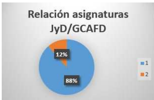
Gráfico 4: Relación asignaturas de Grado con asignaturas obligatorias relacionadas con el bloque de