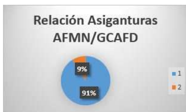
Gráfico 3: Relación asignaturas de Grado con asignaturas optativas relacionadas con AFMN

Se podría hablar del 9.9% de asignaturas relacionadas con el Medio Natural siempre y cuando, el alumnado haya optado por cursar todas las optativas de esta rama, sin embargo, si opta por otras asignaturas el porcentaje baja hasta el 3.8% (Gráfico 2 y 3). Estos datos se alcanzarían realizando la media de todas las universidades, pero si nos centramos en la que menos y la que más asignaturas obligatorias ofertan, los datos revelan que en la Universidad de Sevilla los estudiantes obtendrían el grado habiendo cursado 1 asignatura de este ámbito (2.5%), frente a la Universidad de Almería, donde consiguen el título tras superar 3 asignaturas relacionadas con la AFMN (7.5%).