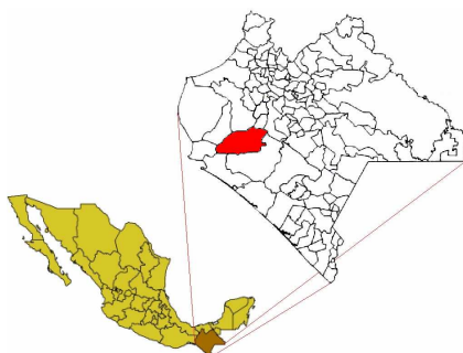
Figura 1. Mapa de ubicación del estado de Chiapas y el municipio de Villaflores

El estado de Chiapas se encuentra ubicado en la región sureste de México, colinda al norte con el estado de Tabasco, al oeste con Veracruz y Oaxaca, al sur con el Océano Pacífico y al este con la República de Guatemala. Al norte 17°59', al sur 14°32' de latitud norte; al este 90°22', al oeste 94°14' de longitud oeste (Chiapas Gobierno del Estado, 2019), en la figura 1 se presenta un mapa de Chiapas. Por otra parte Villaflores es un municipio perteneciente a este estado, el cual tiene una extensión territorial de 1 232.10 Km 2 , limita al norte con Suchiapa, Jiquipilas y Ocozocoautla, al este con Chiapa de Corzo y Villacorzo, al sur con Villacorzo y Tonalá, al oeste con Jiquipilas y Arriaga (SCIM, 2018). En el ámbito económico, el 49.41% de la Población Económicamente Activa (PEA) se encuentra en actividades agropecuarias, el 12.51% se dedica a actividades secundarias y en el sector terciario se encuentra el 36.49% de la PEA (INEGI, 2018).