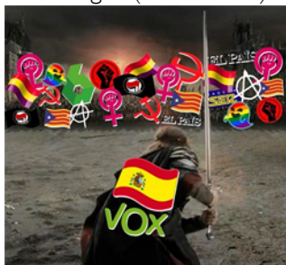
Figura 5. Visual meme donde aparece, sobre una imagen de la película “El retorno del Rey,” un guerrero, identificado con Vox y España contra todos los supuestos enemigos

La utilización de la imagen anterior de la película trajo problemas de derechos de autor.