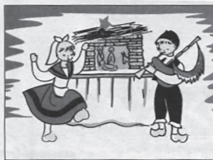
Ilustración 3. Tarjetas de Nadal coleccionadas por Ben-Cho-Shey con nenos e nenas bailando e tocando instrumentos rexionais.