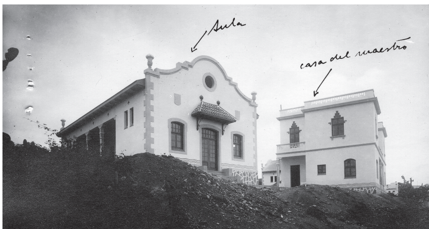
Fotografía 3. Escuela y casa de maestro de Tafira (Las Palmas), 1930.

En cuanto a la distribución de las nuevas escuelas por el territorio nacional es preciso señalar que fue muy irregular. La variedad abarcaba desde municipios que incrementaron notablemente el número de aulas, hasta otros en los que no se construyó ni una sola clase; desde provincias con un incremento significativo en el número de nuevas escuelas, a otras que levantaron un número muy reducido. En segundo lugar, es preciso destacar las diferencias en el trato o consideración otorgado por el Estado a los municipios según su número de habitantes o capacidad económica. En general, las ayudas favorecieron a los grandes núcleos de población, singularmente a Madrid, que si bien veían incrementarse su población escolar durante estos años, y por tanto precisaban más aulas, también es cierto que en general disponían de más recursos. Los municipios de mayor riqueza gozaron de un trato de favor, ya que el Ministerio de Instrucción Pública dio prioridad a las peticiones de aquellos consistorios que se ofrecían a colaborar con una cuota mayor al total del presupuesto. También los pueblos de menos de 500 habitantes disfrutaron de una atención especial por parte del Estado, al estar exentos de contribuir con cantidad alguna, durante algunos años, o exigiéndoles aportaciones de menor cuantía. Lo cierto fue que el presupuesto destinado por el Estado para estas pequeñas localidades se agotaba rápidamente, y muchas poblaciones quedaban relegadas para ejercicios posteriores.