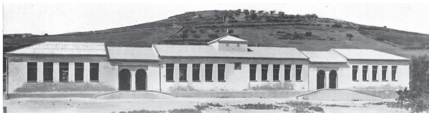
Fotografía 4. Escuelas de Talaván (Cáceres)

De forma muy semejante se trabajó desde 1924 en las tres provincias aragonesas, trufadas también de pequeños núcleos de población, con bajo potencial económico pero que