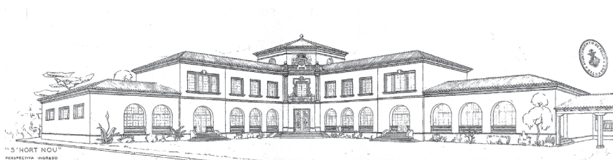
Figura 7. Plano fachada de entrada del G. Esc. Hort. Nou en Palma de Mallorca, 1932.

blica en las ciudades de Madrid, Palma de Mallorca, 32 Bilbao, 33 Zaragoza, 34 Valencia, Oviedo 35 y San Sebastián, 36 y de forma particular en la provincia de Álava. Probablemente, como en el caso de Madrid, estos planes se encontrarían más o menos esbozados en los cajones de las dependencias municipales antes del advenimiento republicano, anhelando una coyuntura favorable para ver la luz o quizá esperando a que una corporación suficientemente audaz se decidiese a ponerlos en práctica. Lo cierto fue que, sin cambiar las condiciones y requisitos exigidos por el Estado a los ayuntamientos para este tipo de iniciativas, ni variar la cuantía del auxilio económico ofrecido por la administración central, estos planes comenzaron a fragar durante la etapa republicana. Los frutos recolectados fueron diversos, oscilando entre la magnífica cosecha de Madrid, a la penuria absoluta de Valencia.