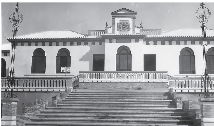
Fotografía 1: Escuela de Morón de la Frontera (Sevilla), 1930.

cuelas, dispusieron los fondos para ello y asumieron la empresa como un asunto de Estado, aunque siempre subordinado a la iniciativa y gestión municipal. El impulso de la administración central al asunto habría resultado estéril sin el apoyo y cooperación de los ayuntamientos, conformados por ediles de todas las tendencias políticas. Considerando, además, que las ideologías parecen estar menos arraigadas dentro de las corporaciones locales que en los gobiernos nacionales, y que en los consistorios municipales los intereses y anhelos ciudadanos encuentran un eco más cercano y directo, no resulta muy descabellado afirmar que fue un aliento social, canalizado a través de los municipios, el factor más decisivo en el crecimiento del parque público de edificios escolares. Realmente los gobiernos centrales y las ideologías que los animaban tuvieron menos importancia de la que se les suele atribuir en gran parte de la bibliografía sobre el tema.