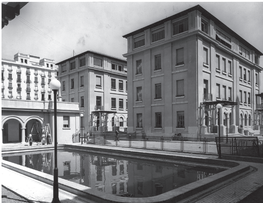
Fotografía 6. Exterior Grupo Escolar. J. Sorolla de Madrid, 1933.

En la segunda capital española, Barcelona, tres notas características enmarcarán la política municipal de construcciones escolares durante estos años: la primera y básica, su deseada autonomía frente al poder estatal, las fuertes demandas de escolarización derivadas del aumento de población, y la última, un gran desembolso económico, motivado tanto por la necesidad de alzar nuevos edificios como por su intención de no acudir al auxilio económico estatal, como única coartada para garantizar su independencia. Esta inversión se vería atenuada por las donaciones particulares de ricos ciudadanos, que entregarían elevadas sumas de dinero al consistorio para levantar nuevas escuelas. Es difícil aventurar una hipótesis que aclarase cuánto más habría crecido la red pública de edificios escolares en esta ciudad si las sucesivas corporaciones municipales hubiesen recurrido al auxilio económico del Estado, y no hubiesen precisado costear durante años los alquileres de numerosos locales en los que se encontraban ubicadas la mayoría de escuelas de la ciudad.