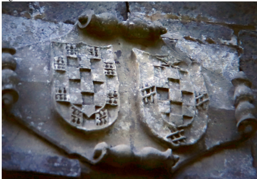
Fig. 8. Armas de Lodeña y Nevares (ca. 1550). Portalada de la casa de Cienfuegos (Muros del Nalón, Asturias)

compilaciones del siglo XV, alusivas a la costumbre de este personaje de esgrimir una en cada mano 13 .