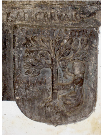
Fig. 11. Labra de las armas de Carballo (1590). Iglesia parroquial de Santo Juliano de Arbás (Asturias)

Los trasvases de información heráldica se han dado en ambos sentidos, y si bien existieron personajes de carne y hueso que adoptaron escudos literarios, las armas de individuos de ficción también se inspiraron en las de linajes auténticos en otras ocasiones. En este orden de cosas, es posible que las vistosas armerías de los villaviciosanos Busto —partido de oro y azur un águila de contracolores— (fig. 12), sobradamente conocidas por figurar en los difundidos armoriales de Garcí Alonso de Torres y Diego Fernández de Mendoza, inspiraran, precisamente por su valor estético, las del príncipe Polindo: “sembrado el campo de unos leoncicos azules y dorados, y en medio una águila muy grande, la mitad de oro y la mitad de azul” ( Cirongilio , 2004: 42).