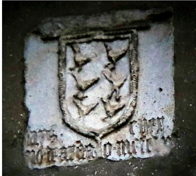
Fig. 9. Labra de las armas de Cuervo (ca. 1500). Casa de Valdés (San Román de Candamo, Asturias)

Aves de poca valía, que de hambre sentís pena, seguid en mi compañía, que de carne ajena o mía, yo os daré a manos llenas.