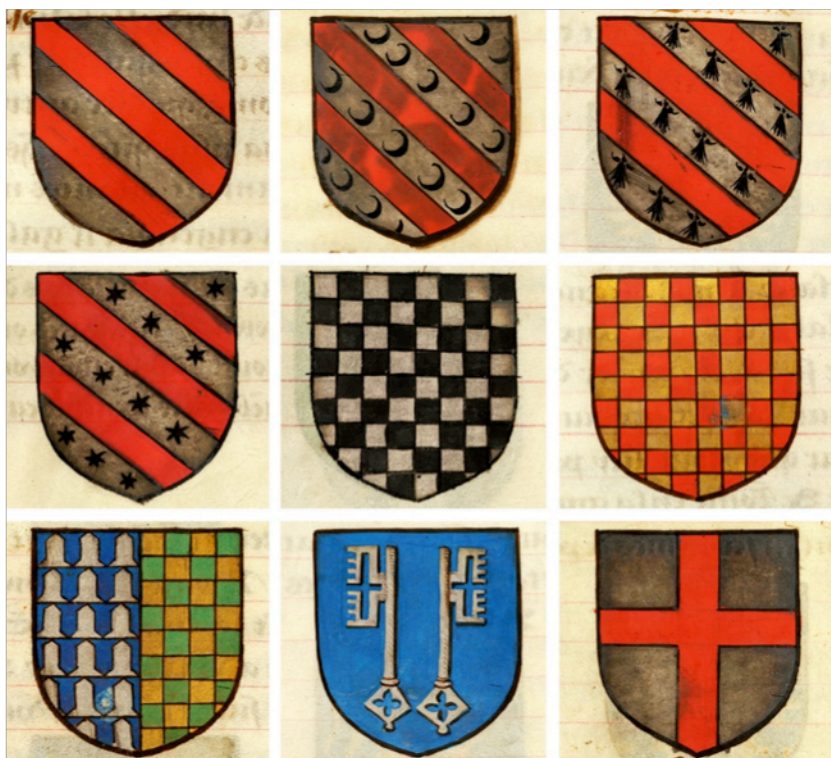
Fig. 1. De izquierda a derecha y de arriba a abajo. Armas de: 1) Lanzarote (fol. 8r), 2) Blanor de Gaunes (fol. 18 v), 3) Boores el Desterrado (fol. 27 r), 4) Lionel (fol. 8r), 5) Palamedes (fol. 61 r), 6) Esclabor (fol. 36 v), 7) Safar (fol. 37 r), 8) Keu (fol. 33 r) y 9) Galaz (fol. 23 r). En Noms, armes et blasons des chevaliers de la Table Ronde (ca. 1500), © The Morgan Library and Museum, Nueva York, Ms. M. 16

distinción se lograba a través de cambios de color, como ocurría con los jaquelados de Palamedes (plata y sable), su padre el rey Esclabor de Babilonia (oro y gules) y su hermano Safar (oro y sinople) (Pastoureau, 1982b) (fig. 1).