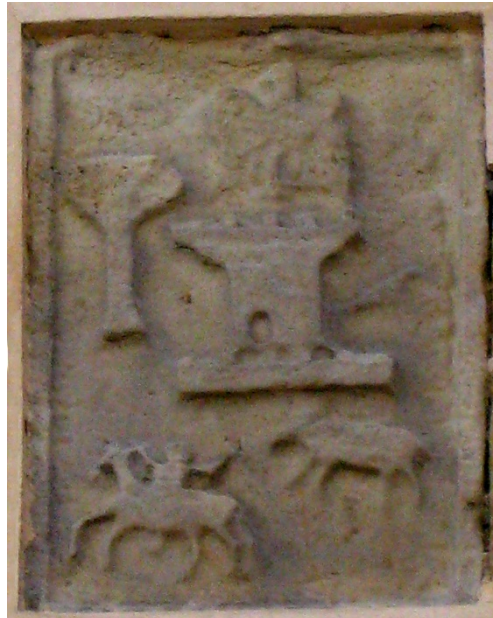
Fig. 4. Labra de las armas de Ribero (ca. 1500). Casa de Ribero (Llanes, Asturias)

En este artículo pretendo establecer el alcance de la imaginación heráldica de los autores de los libros de caballería, que procuraban conferir veracidad a sus personajes atribuyéndoles escudos de contenido mayoritariamente alegórico, elaborados de acuerdo con los gustos que informaban el diseño de armas auténticas en el siglo XVI 2 . Dicho de otro modo, los textos literarios son un reflejo de las costumbres de la época en que fueron escritos y su examen puede aportar valiosa información sobre el intenso y extenso recurso al simbolismo propio de la sociedad del momento. Con el fin de iluminar ese pasado examinaré las formas plásticas utilizadas en la composición de las armerías literarias, distinguiendo entre los que pudieran considerarse atavismos, en cuanto mantenedores de las antiguas prescripciones establecidas en el blasón medieval, y las innovaciones, seguidoras de la moderna modalidad escénica. Asimismo, rastrearé la persistencia de los usos heráldicos tradicionales, con el propósito de averiguar su grado de continuidad en el trazado de las armerías ficticias. Por último, investigaré los flujos osmóticos entre literatura y realidad, a través de aquellos escudos auténticos inspirados en otros novelescos, así como la situación inversa de los ficticios procedentes de armerías de individuos de carne y hueso.