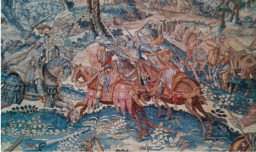
Fig. 5. Tapiz de la liberación de Oriana (ca. 1590, detalle). Diseño de Karel van Mander. Taller de Frans Spiering. Metropolitan Museum of Art, Nueva York (Nº inventario 2006.36)

negro, pero había las uñas blancas y los dientes y la boca bermejas” ( Amadís de Gaula , vol. I, 1991: 667), quizás sea el único ejemplo hispánico de las llamadas sombras heráldicas, es decir, figuras del mismo esmalte que el campo que sólo se identifican por su perfil, cuyo rarísimo uso está documentado en Francia desde el siglo XIV (Pastoureau, 1993: 108).