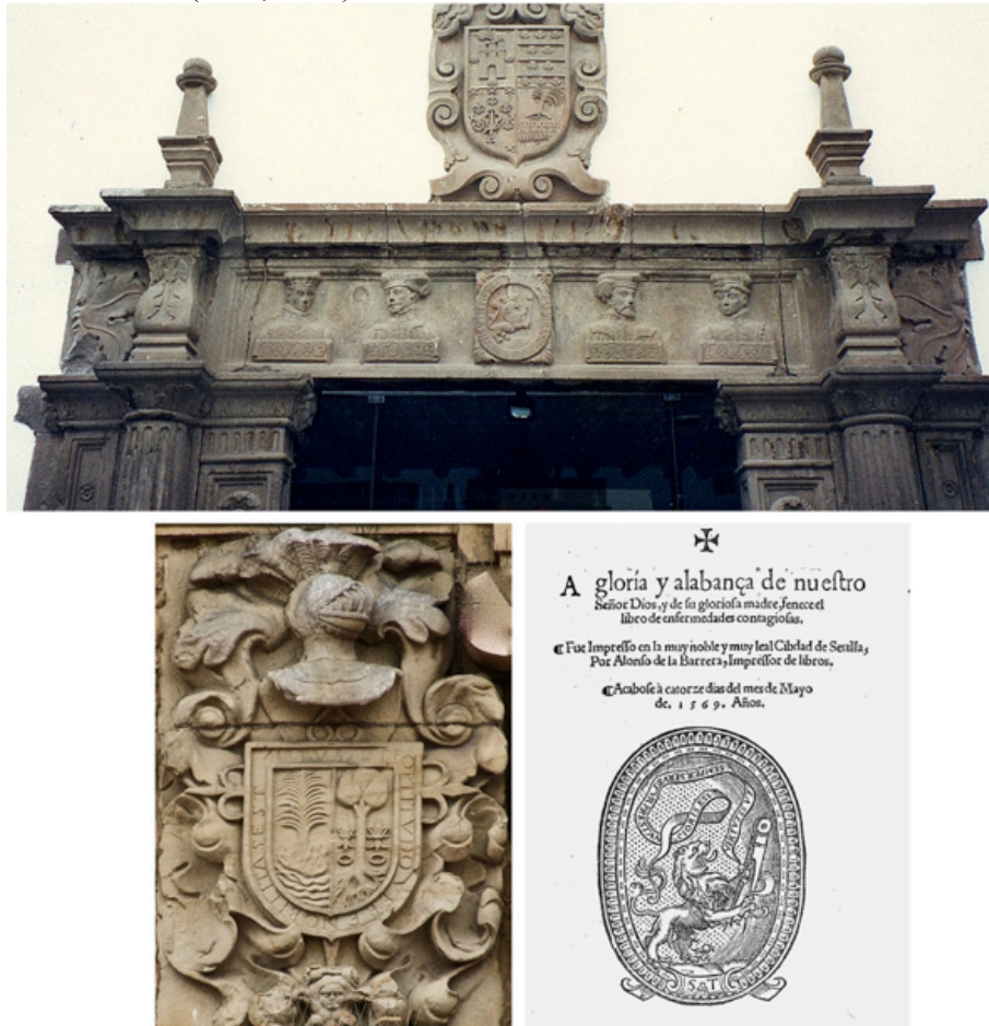
Fig. 10. Parte superior de la portada de la casa de los Cuatro Bustos (Cuzco, ca. 1560). Labra de las armas de Doriga y Malleza (1673) en el palacio de Toreno (Oviedo). Colofón del impresor Alonso de la Barrera en Francisco Franco, Libro de las enfermedades contagiosas y de la preservación dellas , Sevilla, 1569

por su tío, el conquistador Juan de Salas de Valdés, donde la novedad acompaña a las armas de Salas, Valdés y Doña Palla en la cuarta posición de un cuartelado (Tord, 1978).