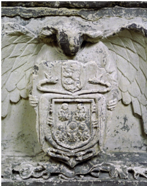
Figura 13. Labra de las armas de Diego Fernández de Miranda (ca. 1500). Museo arqueológico de Asturias (Oviedo)