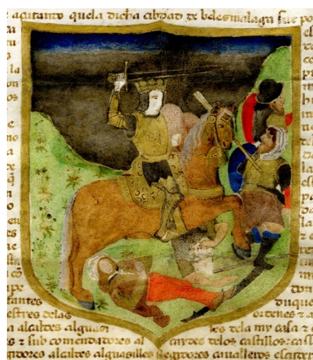
Fig. 2. Escudo de la villa de Vélez-Málaga (1499). Real provisión conservada en el archivo municipal, Documentos reales, 1-2, 10.

vos doy por armas un rey a cavallo con un moço de espuelas muerto a los pies e con los moros huyendo segund va pintado en esta mi carta, a memoria de lo que al dicho rey mi señor acaeciò en esa çibdad al tiempo que la tuvo çercada e la ganó de los dichos moros.