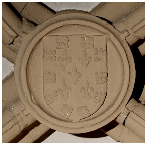
Fig. 6. Diomedes de Argos degollando al sagitario. En Benoit de Sainte Maure, Crónica troyana (ca. 1350), Real biblioteca de San Lorenzo del Escorial, Ms. h-I-6, fol. LXX r. Labra de las armas de Argüelles (ca. 1390). Iglesia parroquial de San Tirso (Oviedo)