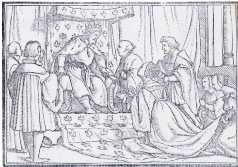
Fig. 6. Retratos o tablas de las historias del Testamento Viejo , Lyon, 1543

De los Retratos copia fielmente el grabado que ilustra el libro I y II de Esther, en concreto el momento en el que el rey Asuero repudia a Vasthi por desobediente al no comparecer en el banquete a su requerimiento y elige a Esther como nueva esposa, momento que inmortaliza la quintilla: “El rey Assuero mostrando / Su grande gloria y poder / Un combite celebrando / A Vasthi muger dexando / Escoge de nuevo a Ester” (h. K1v.) (fig. 6).