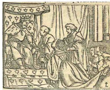
Fig. 7. Cárcel de amor , Zaragoza, 1551

Holbein presenta al rey de Persia sentado en un trono adornado con un sembrado de motivos vegetales que se han identificado con lirios o con la flor de lis, emblema heráldico de la monarquía francesa (Woltmann 1869: 28), aunque también muy utilizado como tema ornamental en la Europa occidental (Pastoureau, 2006: 118). La misma decoración aparece en otras obras de Holbein, por ejemplo, en el trono del rey sentado a la mesa en la Danza de la Muerte , en la “Cólera de Roboam”, recreada en el fresco que adorna una de las paredes de la Grossratsaal del ayuntamiento de Basilea (Salvini/Werner Grohn, 1972: 91-92, fig. 30j) o en la pintura, un poco posterior (c. 1535 y 1540), del rey Enrique VIII recibiendo, cual Salomón, a la Reina de Saba ( Collection of His Majesty the King en el Castillo de Windsor).