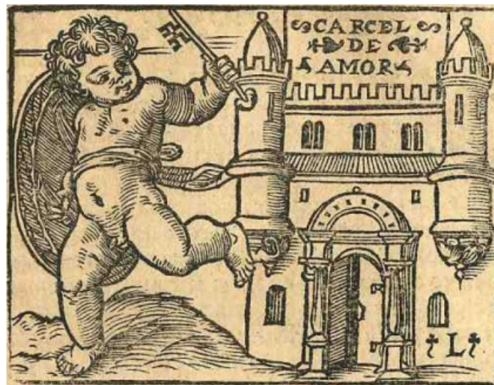
Fig. 14. Cárcel de amor , 1551

título, pero con evidentes modificaciones. Como en los casos anteriores, el grabado (fig. 14) no es original y resulta de la copia y unión de dos estampas diferentes inspiradas en las obras antes comentadas. El grabador funde en una sola xilografía un grabado de los Retratos y otro de Les images de la Mort . De los Retratos toma la estampa que representa la visión del nuevo templo de Jerusalén según la descripción del profeta Ezequiel (fig. 16), precedida de una cita latina del libro de Ezequiel, capítulo XL (“Ezechieli prophetae futura restauratio civitatis & templi in visionibus ostenditur”) y seguida de una cuarteta que dice: “A Ezechiel demostrado / Fue en visión muy claramente / Que el templo ya derrocado / Sería bien restaurado / Y la ciudad juntamente” (h. L3r.). Si en el texto bíblico se describe con detalle el nuevo templo, sus alturas en codos, puertas, dependencias y adornos, en el grabado se presenta solo la fachada. El monogramista L por su parte ha copiado solamente la parte central del grabado originario, la correspondiente a la puerta oriental del templo contemplado en su visión y ha sustituido la inscripción de la cartela central por la de “Cárcel de amor”, equivalente a la filacteria que identifica el edificio y da título al libro en las ediciones incunables (fig. 11).