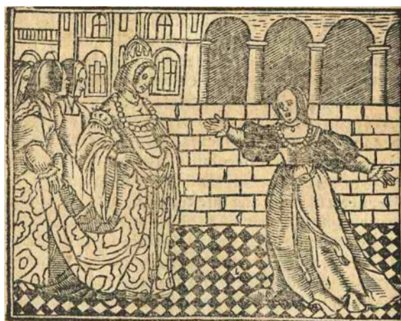
Fig. 10. Cárcel de amor , Zaragoza, 1551