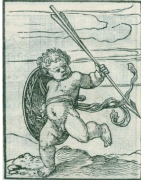
Fig. 15. Les images de la Mort , Lyon, 1562