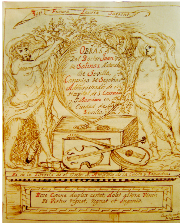
Fig.1. Real Academia Española, ms. RM-6946, portada

adorno floral y otros primores caligráficos, y el frontispicio precedente lleva debajo de la cartela inferior la firma inequívoca de que «Cuesta lo ideó y dibujó», en un errático latín abreviado que apunta a una falsa etimología: «Cuesta imb. et | deligneab.» 16 , si es que se debe desarrollar y corregir como «Cuesta inveniebat et delineabat». Estos descuidos ortográficos, que veremos abundar en el inventario que aquí doy a conocer, contrastan con el lema y el dístico elegíaco con que glosa de su propia minerva las figuras del frontispicio 17 .