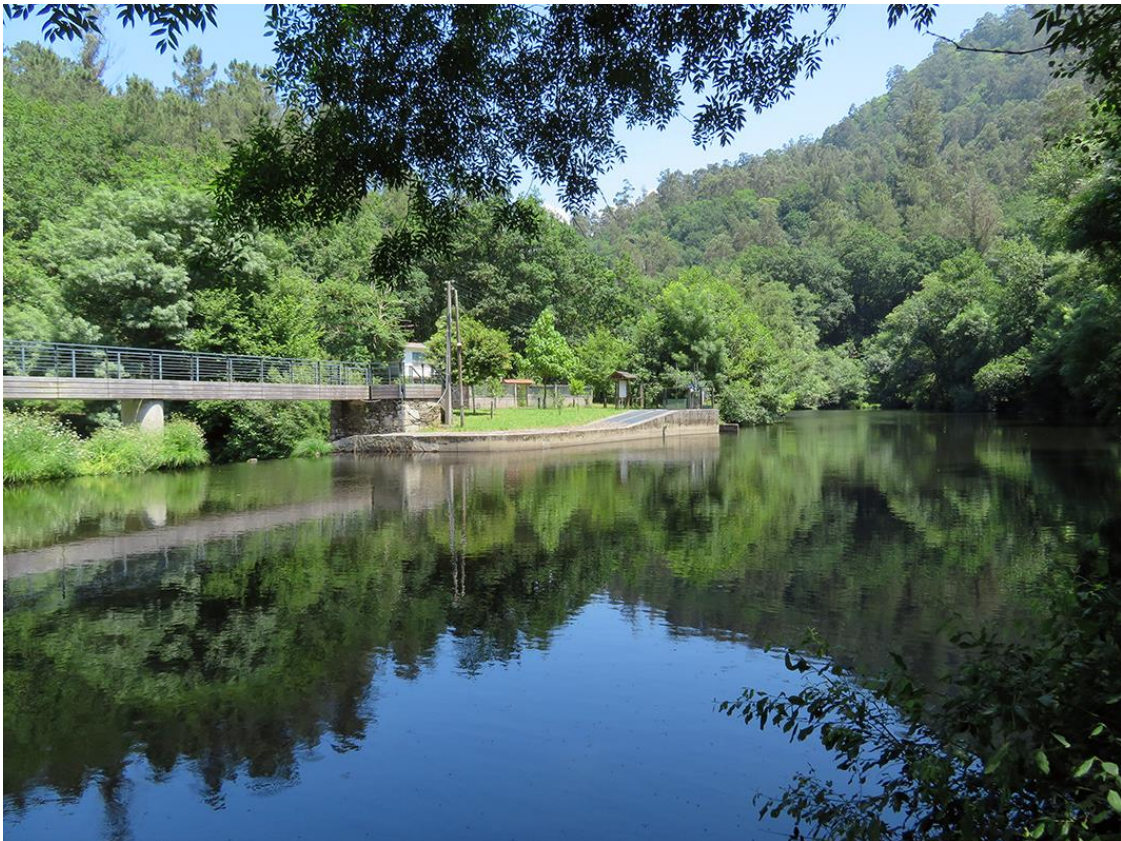
Figura 3. Zona de estudio: lugar de Chelo, río Mandeo, Paderne (orilla derecha) y Coirós (orilla izquierda), A Coruña. Se trata de un espacio natural con una serie de estructuras (puente, muros y construcciones) rodeada de densa cobertura arbórea que cubre las riberas y laderas. La población de Iberolacerta monticola depende de las estructuras y zonas despejadas que reciben radiación solar para sobrevivir.

El coto fluvial de Chelo es una zona llana encajada en una ladera con bastante pendiente y densa cobertura arbórea. En ella encontramos un centro de interpretación de la naturaleza y un área recreativa en la orilla izquierda, un puente que une ambas orillas, y en la orilla derecha, una casa abandonada y una zona rocosa con piedras que corresponde a una vieja construcción derruida. Es precisamente en estos lugares construidos por el hombre donde se encontraron en mayor medida individuos de I. monticola [Figura 3].