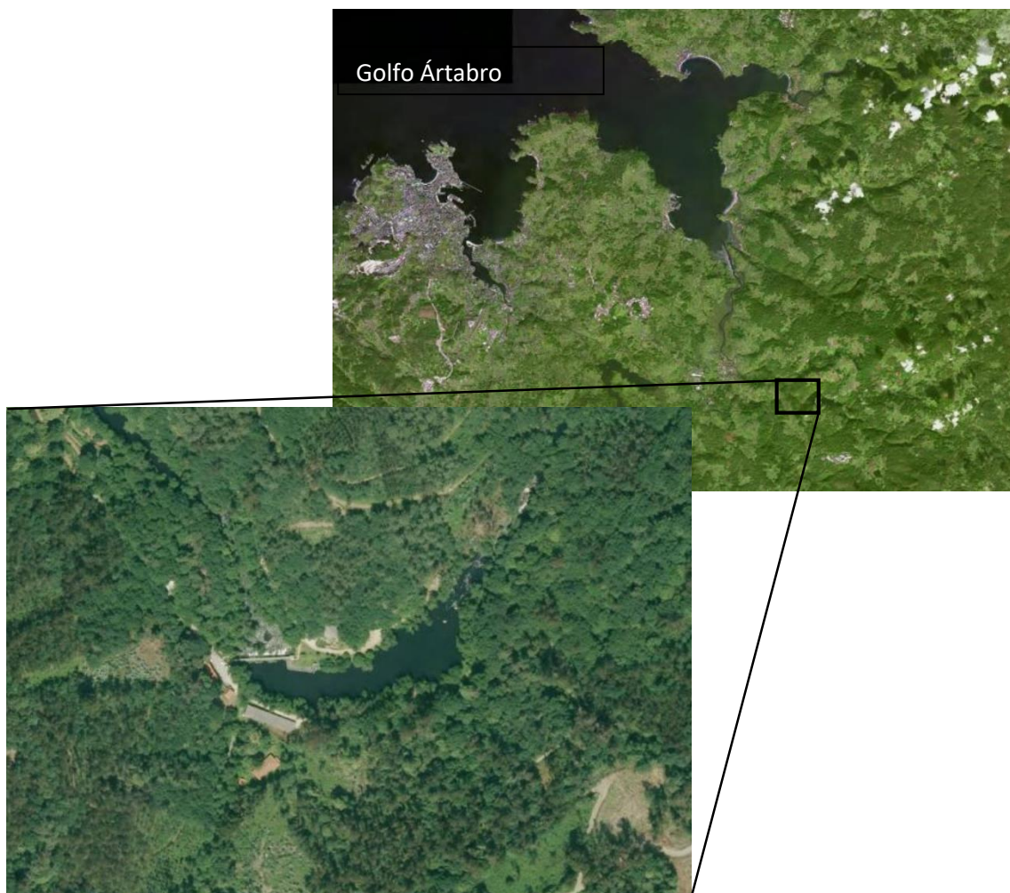
Figura 2. Localización geográfica del coto fluvial de Chelo. Imágenes aéreas a escala 1:216672 (arriba) y 1:3385 (abajo) (IGN, 2019).

inadecuados entre ellas. La que nos ocupa se encuentra en el coto fluvial de Chelo, en el tramo bajo del río Mandeo (orilla izquierda: parroquia de Colantres, Concello de Coirós, A Coruña; orilla derecha: parroquia de Vilamourel, Concello de Paderne, A Coruña. UTM: 29T NH 69; 43° 15' 50''N 8° 9' 54'' W). La altitud media es de 9 m sobre el nivel del mar. Esta área está incluida dentro del clima Oceánico Húmedo, característico de las zonas costeras del noroeste ibérico. La temperatura media del mes más frío, febrero, es de 7 °C y las temperaturas medias del mes más cálido, agosto, oscilan entre 16,6 °C y 17,6 °C (Martínez-Cortizas et al. , 1999) [Figura 2].