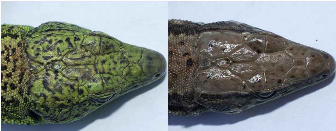
Figura 5. Detalle de las cabezas de un macho (izquierda) y una hembra (derecha). Podemos observar los distintos patrones en las escamas que permiten identificar a cada individuo.