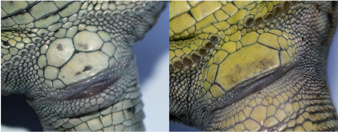
Figura 4. Detalle de las zonas cloacales de un individuo hembra (izquierda) y un macho (derecha). Podemos ver el distinto número de escamas perianales de cada individuo.