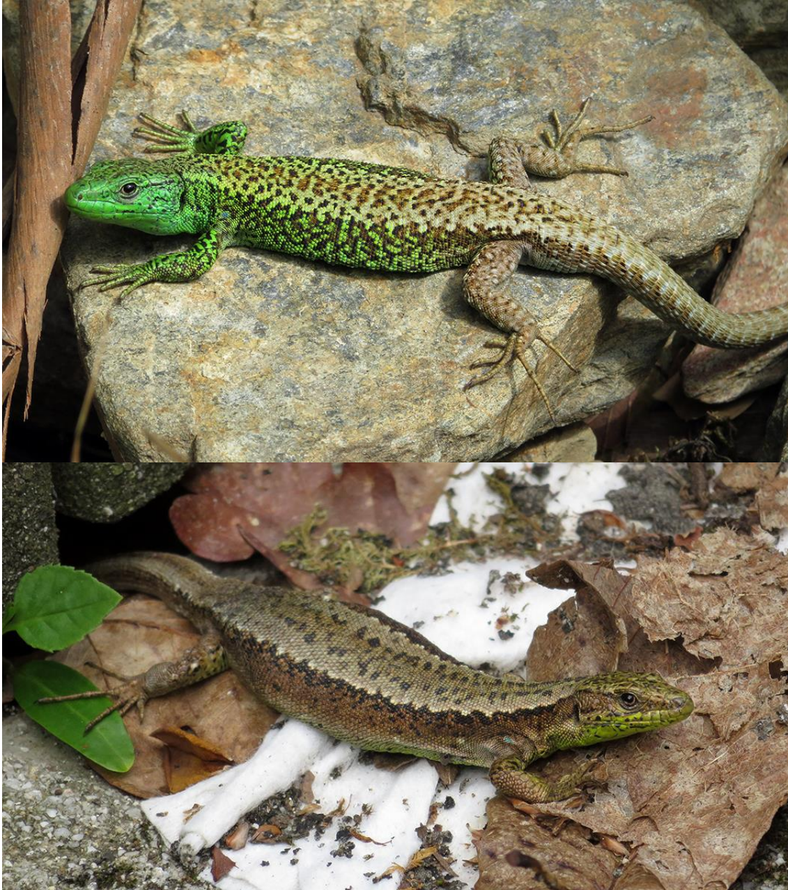
Figura 1. Macho (arriba) y hembra (abajo) de lagartija cantábrica ( Iberolacerta monticola ) de la zona de estudio (Chelo, río Mandeo, A Coruña).

longitud del cuerpo, con un dimorfismo sexual tanto en el tamaño corporal (mayor en los machos) como en la coloración dorsal en los adultos (pardo en hembras y verde en machos) (Arribas, 2014) [Figura 1].