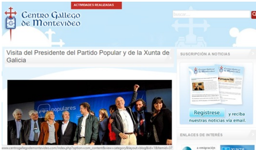
Imagen 3: Noticia sobre la visita del Presidente de la Xunta de Galicia en la página web del Centro Gallego de Montevideo