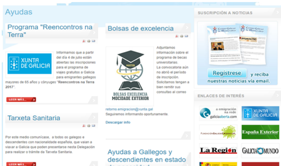
Imagen 2: Web de la Casa de Galicia de Montevideo con relación de ayudas ofertadas por la Xunta de Galicia a los socios