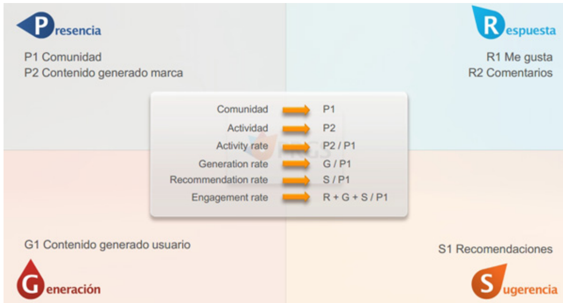
Figura 2: Modelo PRGS