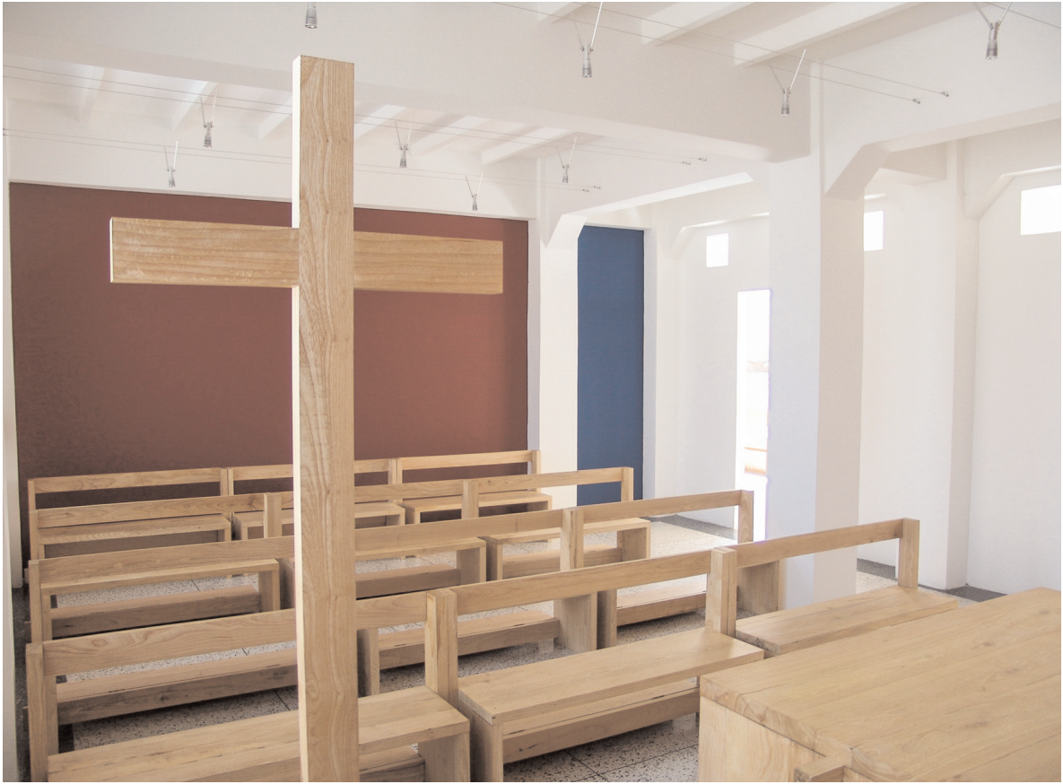
Fig. 08. Área de los bancos. Diseño de José Luis Chacón.