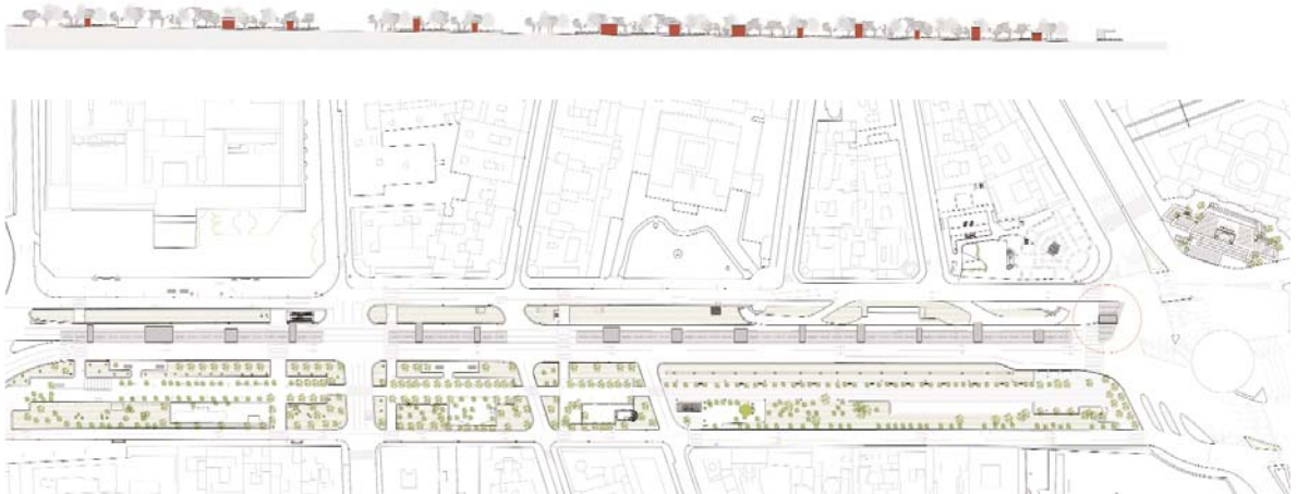
Fig. 08. Reset Arquitectura (Eduardo Delgado Orusco), Vía Crucis de la JMJ Madrid 2011; planta y sección general.

En 1985, en San Pedro, se reunieron con el Santo Padre 300.000 jóvenes con su Cruz. Como consecuencia de este encuentro, se instauró una Jornada Mundial de la Juventud (JMJ) anual. Desde 1986, la Cruz ha recorrido doce países de Europa, Asia, América y Oceanía; y siempre ocupa un lugar protagonista en las celebraciones: «La Cruz, el suplicio inefable divino de amor». A esta peregrinación se le suma la invocación a María, cuando en la JMJ Toronto 2003, Juan Pablo II regaló a los jóvenes el icono de la Virgen María para que, junto a La Cruz, les acompañase siempre en sus peregrinaciones y encuentros.