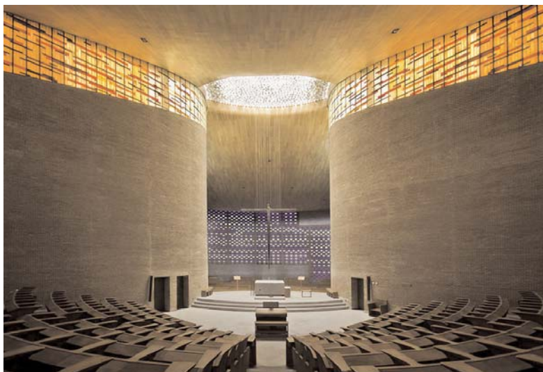
Fig. 01. Miguel Fisac Serna, Iglesia del Teologado de San Pedro Mártir, Alcobendas (Madrid), 1955/60.

«Lograr que un Viacrucis sea algo gozoso, luminoso, no es fácil. Las cajas de luz con las que resuelve el tema hablan de la talla de arquitecto de su autor, capaz de dar el máximo en todas y cada una de las ocasiones que se le presentan: aquí con muy poco y con la idea de desaparecer, de poner en valor lo que se enmarca, como lo hace un buen marco en una buena pintura» 1 .