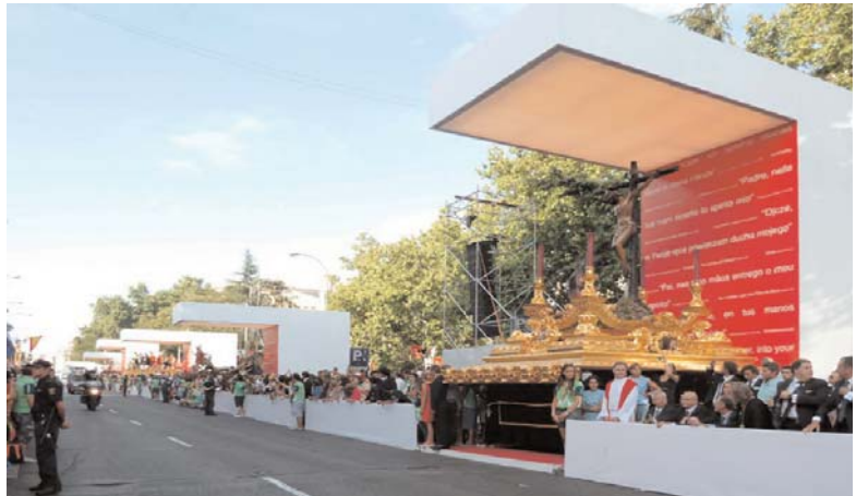
Fig. 15. Vista desde el eje de peregrinación.

de manos de las cofradías, en procesión, cada uno de los quince pasos.