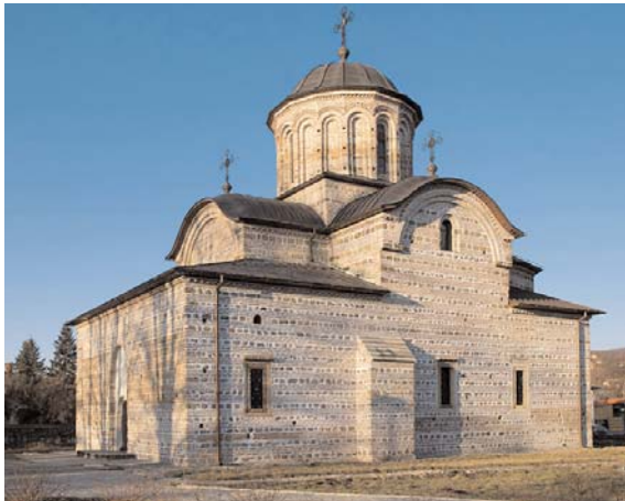
Fig. 04. San Nicolás (Biserica Domnească Sf. Nicolae), Curtea de Arges (Rumanía), 1340/76.

de los límites del espacio. Aquí, además del diseño, una vez más los materiales pueden ser responsables de este efecto, transmitiendo, por ejemplo, peso o solidez al embasamiento. Este efecto se asocia a una mayor estática de la base que, por contraste, puede evidenciar también toda acción de participación peatonal, mientras que encima de todo puede ganar otro dinamismo. En las alturas, la ligereza y la ornamentación de los materiales, así como la introducción de los elementos decorativos, podrá ser más intensa por ser menos impositiva.