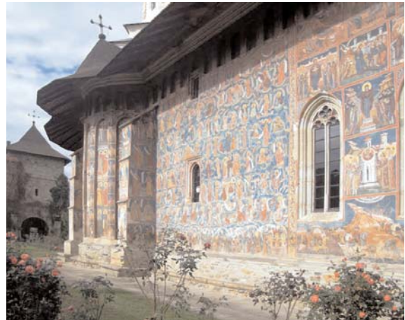
Fig. 03. Monasterio Moldovita, Vatra Moldovitei (Rumanía), 1532.

En la arquitectura de las iglesias, algunos movimientos de vanguardia como el abstraccionismo o incluso tendencias más recientes como el minimalismo, redujeron las posibilidades de la lectura de las señales y por lo tanto de su adhesión. Es cierto que trajeron nuevas formas de ver y de relacionarse con la realidad, pero fueron incapaces de sustituir todo aquello que eliminaron.