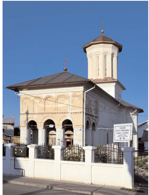
Fig. 05. Iglesia ortodoxa, Targoviste (Rumanía), h. 1517.

Los recorridos que respetan los alineamientos axiales en la dirección del altar o tangentes a este tienden a