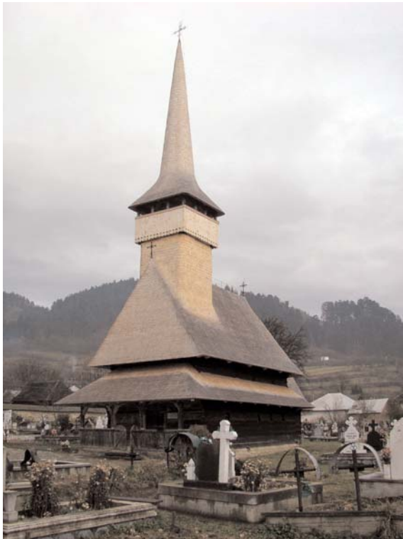
Fig. 02. Iglesia de los Santos Arcángeles, Rozavlea, Maramures (Rumanía), 1717/20.

camuflaba ya la experiencia de lo esencial. En el Concilio Vaticano II se cumple la tradición de la Iglesia.