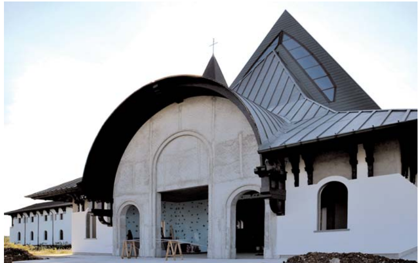
Fig. 06. Tudor Radulescu, Convento de los Carmelitas Descalzos, Snagov (Rumania), 2013; pórtico.

además del ángulo de abertura de su visión frontal, son fundamentales para que no se reduzca la intensidad de su relación con la asamblea.