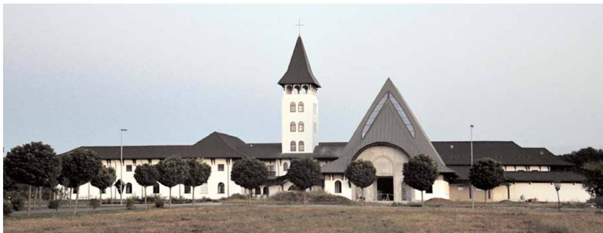
Fig. 01. Tudor Radulescu, Convento de los Carmelitas Descalzos, Snagov (Rumanía), 2013.

«Hemos asistido a una paradoja: la fe cristiana, cuya novedad e incidencia en la vida de los hombres, desde el principio, se había expresado con el símbolo de la luz, a menudo ha sido descalificada como la oscuridad de la superstición que se opone a la luz de la razón. Y así se ha vuelto imposible la comunicación entre la Iglesia y la cultura de inspiración cristiana, por una parte, y la cultura moderna de signo iluminista, por otra. Ha llegado ahora el momento, y el Vaticano II inauguró precisamente esta nueva etapa, de entablar un diálogo abierto y sin prejuicios, que haga posible de nuevo un encuentro serio y fecundo». Francisco, «Carta a quién no cree», La Republica , 11/09/13.