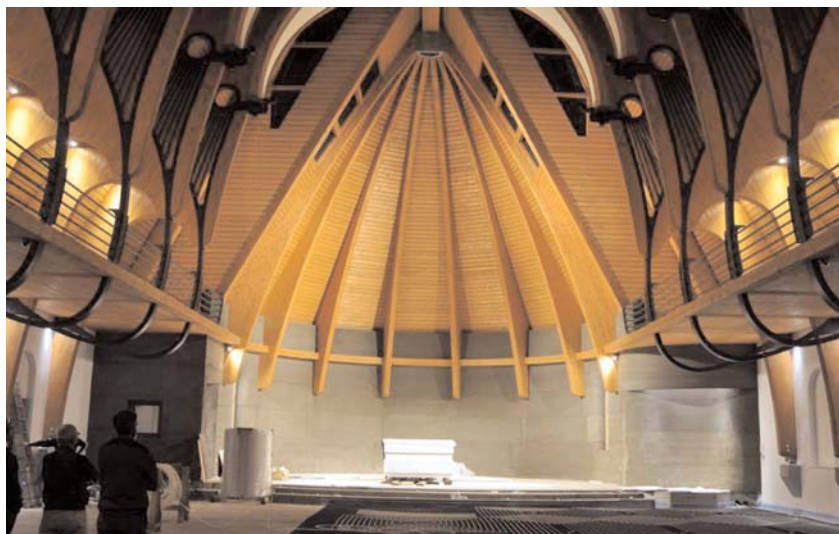
Fig. 08. El presbiterio desde la nave.

La excepcionalidad del acontecimiento que ocurre en la liturgia no justifica nada más que la clarificación de lo que está aconteciendo realmente. Como todo en la liturgia, la iglesia debe limitarse a subir el velo de las apariencias para evidenciar la belleza del hecho.