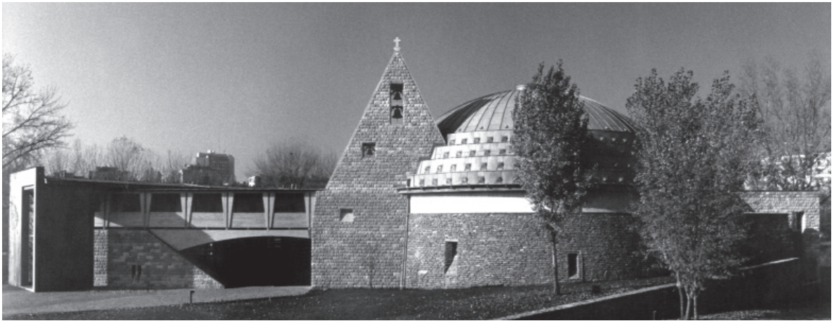
(En la página anterior) Fig. 3. Imre Makovecz, iglesia católica romana, Paks, 1988/92.