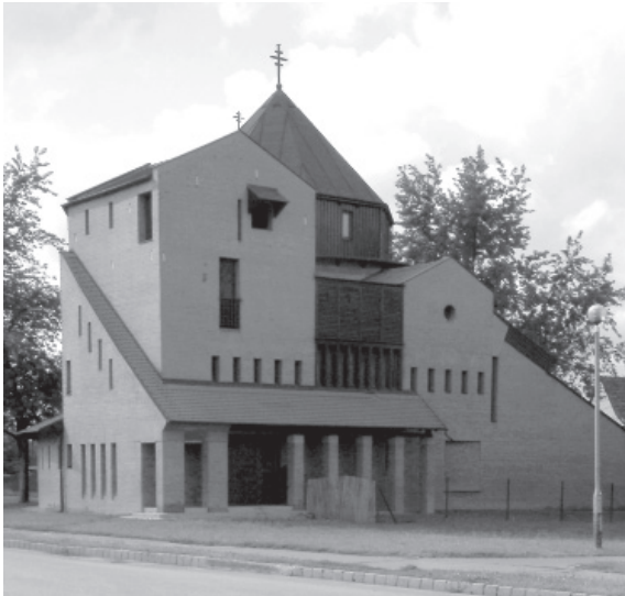
Fig. 7. Mihály Balázs, iglesia católica griega, Kazincbarcika 1991/95.