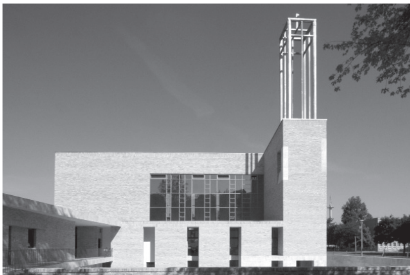
Fig. 5. Gábor Kruppa, iglesia católica romana, Budapest-Ujpalota, 2008.

frente con su elevación monumental. La armonía nace de la delicada sonoridad del ritmo y de las escalas de las aperturas, mientras que la ligereza y consistencia formales apenas da la oportunidad de apegos emocionales. Los espacios, de pureza casi evangélica, se reúnen en uno genial e íntimo por medio del uso de un maravilloso mobiliario realizado en madera y de elementos estructurales pintados de blanco. En el ábside semicircular del altar, las vidrieras destellan con las luces de los colores primarios, presentando una transcripción en color y sonido de la melodía gregoriana «Kyrie eleison».