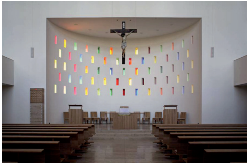
Fig. 6. Tamás Nagy, iglesia católica romana, Gödöllő, 2001/07.