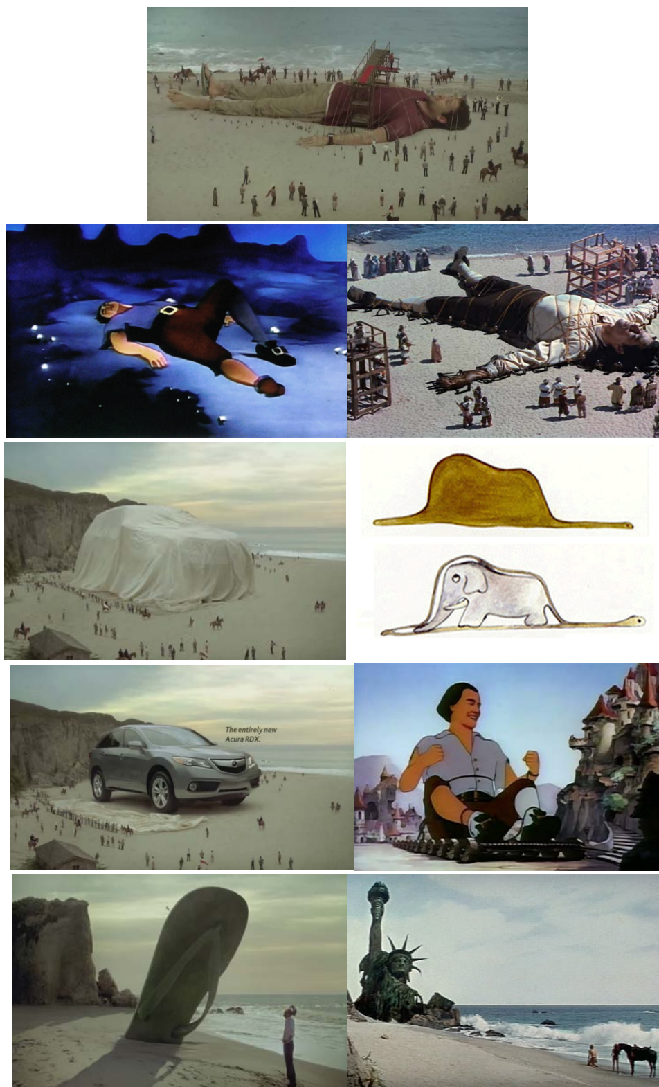
Figura 4. Selección de fotogramas del spot de Acura y sus distintos paralelos visuales