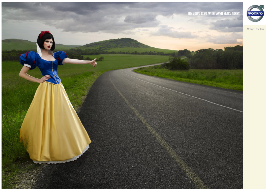
Figura 3. Cartel publicitario de Volvo

De alguna manera, la transformación del relato en el anuncio implica la inutilidad narrativa que representan los enanitos, por cuanto ni pueden proteger a Blancanieves en su refugio ni, una vez sedada, pueden devolverle la consciencia. En otras palabras, ¿quién es el destinatario del pulgar extendido de Blancanieves: los enanos que se aproximan con el Volvo o el espectador que únicamente puede encontrar una Blancanieves si su coche cuenta con asientos suficientes? ¿Se trata de un coche “de fábula” desde el que se puede intervenir en el relato? En fin, de los enanos del cuento solamente queda el número, de tal forma que la única lectura posible es convertir al espectador en rescatador de la princesa, con toda la ambigüedad que ello supone para cada tipo de receptor y acerca de los motivos por los que la protagonista femenina huye haciendo autostop . Al cabo, la propuesta es tan polisémica que el intertexto permite numerosos interrogantes y respuestas.