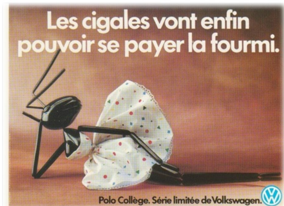
Figura 2. Cartel publicitario de Volkswagen

Finalmente, ambas opciones se aplican a un vehículo que posee dos facetas: la diversión y el trabajo. No hay que olvidar que se trata de un coche cuyo sobrenombre “Collège” implica un destinatario específico: el estudiante universitario, que ha de combinar una situación profesional que no es propiamente laboral con su dedicación al estudio, o la posibilidad de alternar el esparcimiento con el trabajo intelectual. De esta manera, se combinan tanto en el estudiante como en el coche sus respectivas cualidades de cigarra y de hormiga. Y, al presentarse como una compra asequible, los estudiantes-cigarras pueden “hacerse con la hormiga”: una forma de divertirse sin renunciar a la responsabilidad para formarse.