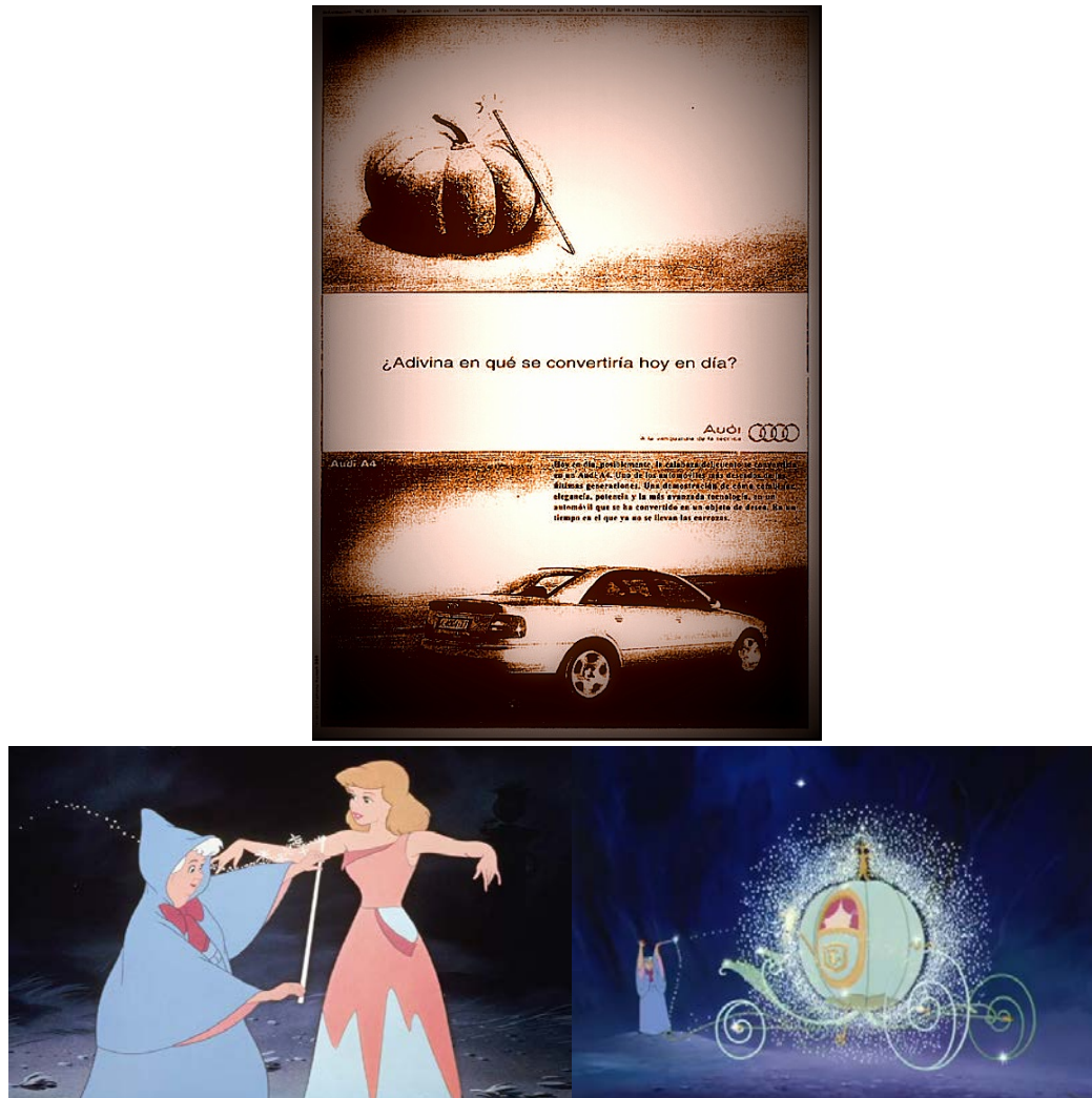
Figura 1. Cartel publicitario de Audi y fotogramas de la versión de Cenicienta según los estudios Disney