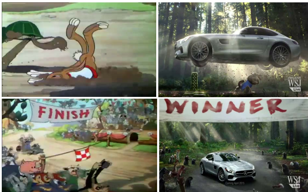
Figura 5. Selección de fotogramas del spot de Mercedes Benz y del cortometraje de Disney

La moraleja inicial de la fábula apunta en diferentes direcciones: de un lado, el castigo a la soberbia de la liebre por creerse superior y, de otro, la recompensa al esfuerzo en proyectos de larga duración que recae sobre la lenta tortuga. Pero, sobre todo, se trata de una reflexión sobre la confianza en uno mismo: el exceso de autoestima que hace que la liebre se entretenga (se duerma, en la fábula inicial) frente a la perseverancia que hace que la tortuga termine logrando el triunfo. Ahora bien, lo que destaca la campaña publicitaria es la asunción de retos y el carácter festivo de la rivalidad deportiva, sin que en ningún momento se haga alusión a las condiciones injustas del reto.