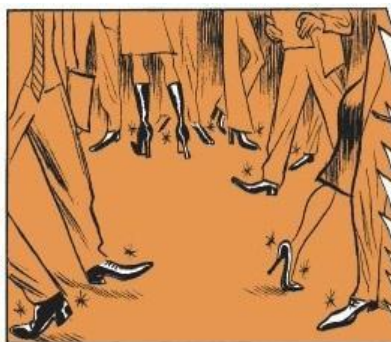
Fig. 3. Viñeta del segundo tomo

El hecho de unir dos tomos en una película hace que se rechacen y sinteticen muchos eventos. La mayoría de eventos del segundo tomo son eliminados y otros pocos incorporados en la película, mientras que los eventos del primer tomo son transformados.