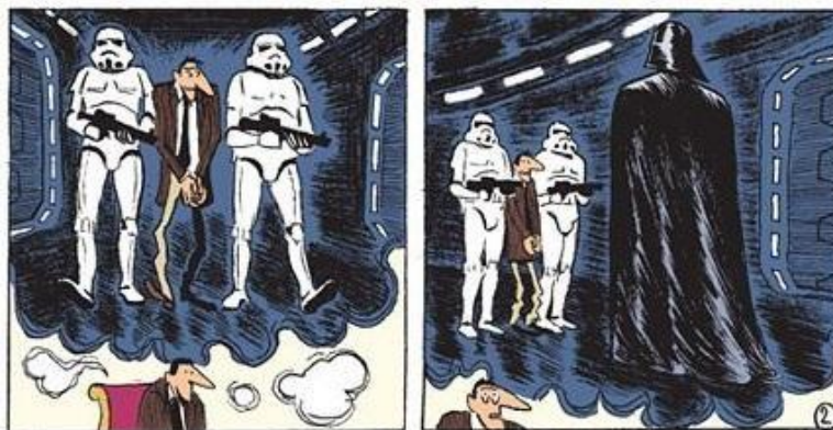
Fig.6. El consejero de lenguajes escoltado por los guardianes