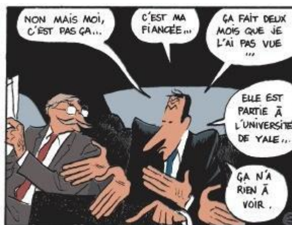
Fig.4. Conversación sobre Marina

Las adaptaciones al cine suelen tener un margen de fidelidad a la idea original más o menos alto. En nuestro caso, podemos comparar escenas con viñetas, fieles a cada palabra. En otros casos, los guionistas reescriben la trama y modelan los personajes. Este último punto ha sido el más dolorosamente atacado por el cine, especialmente en los personajes femeninos.