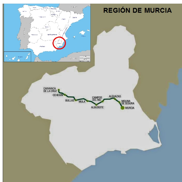
Figura 1. Recorrido de la línea de ferrocarril Murcia-Caravaca, hoy transformada en la Vía Verde del Noroeste.

Para La Vía Verde del Noroeste acondiciona el antiguo trazado ferroviario entre Murcia y Caravaca de la Cruz puesto en marcha en 1933, que con un recorrido de 78 Km entre la antigua estación de tren de Caravaca de la Cruz y la ciudad de Murcia (Figura 1),