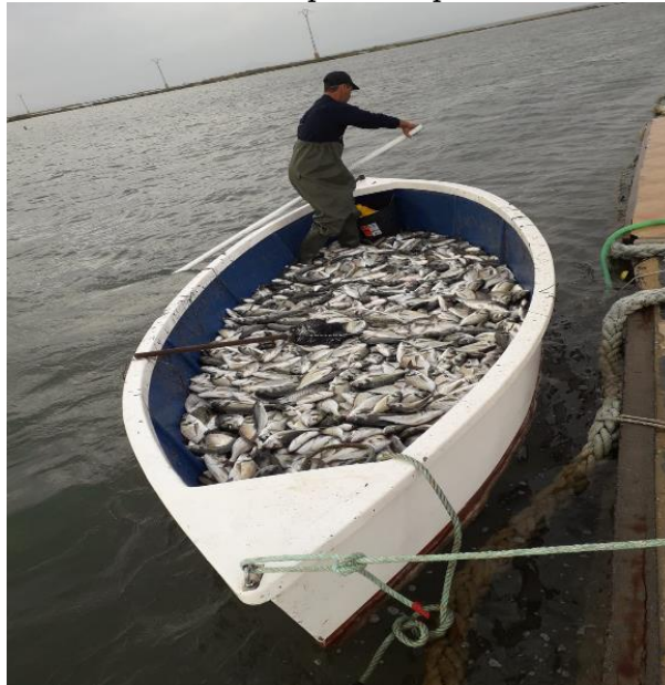
Imagen 3. Pescador con el barco lleno de pescado procedente de las encañizadas