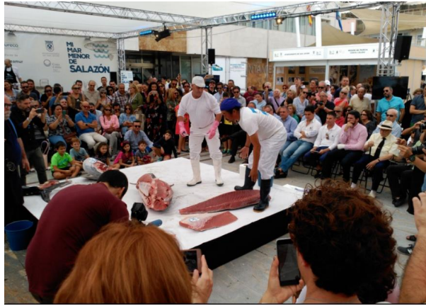
Imagen 6. Ronqueo del atún en las Jornadas Gastronómicas Mi Mar Menor de Salazón

de los artes y sistemas de pesca tradicionales del Mar Menor, así como una visita guiada en barco a las mismas (Imagen 6).