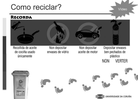
Fotografías 2 a 3: Exemplos da campaña de motivación e divulgación