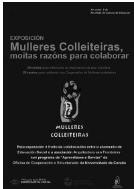
Fotografía 4: Panel de inicio da exposición.

5. A avaliación do proceso e dos resultados concreouse na avaliación do deseño da campaña de sensibilización e das accións contempladas, por parte do profesorado implicado e das Mulleres colleiteiras; foi un proceso de avaliación continua en sesións de titoría e de avaliación final, no que tamén participaron ASF e as Mulleres colleiteiras , que comprobaron un incremento moi importante de aceite depositado nos contedores no remate da campaña de sensibilización.