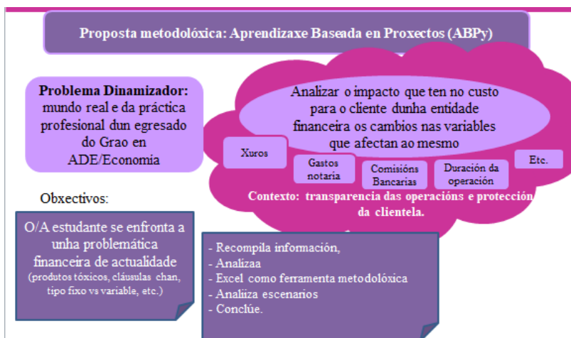
Imaxe 1. Resumo gráfico da proposta.

Propónse un achegamento teórico-práctico á problemática das operacións financeiras, para o que se consultará e revisará bibliografía. Analizaranse ademais as distintas variables e o seu impacto no custo (TIR) das operacións financeiras. Empregarase a folla de cálculo como ferramenta metodolóxica xunto coa análise de escenarios (Imaxe 1).