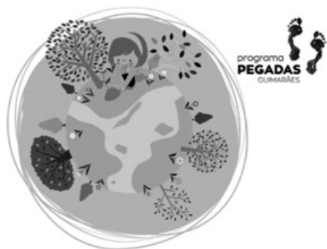
Figura 1: Programa de Educação Ambiental-PEGADAS

A Educação Ambiental é hoje assumidamente um dos pilares fundamentais de uma estratégia que vise o desenvolvimento sustentável de um território e a alteração de alguns paradigmas e comportamentos, a prova disso é a recente apresentação da Estratégia Nacional de Educação Ambiental 2020 que aponta como “ crecente a importância da atuação dos técnicos, tanto das autarquias como dos equipamentos de educação ambiental no desenvolvimento de projetos ou programas de Educação Ambiental ”, reconhecendo já a “ existência na grande maioria dos municípios de profissionais ligados aos pelouros de Ambiente e Educação com competências técnicas específicas que promovem já um conjunto de atividades nesta área ” (REPÚBLICA PORTUGUESA, 2016). Também já anteriormente a Agenda 2020, tinha estabelecido metas ambiciosas para redução de 20% de emissões de gases, incremento do uso de energias renováveis em 20%, ou mesmo redução de 20% do consumo energético, metas consubstanciadas nos programas Europa 2020 e Portugal 2020.