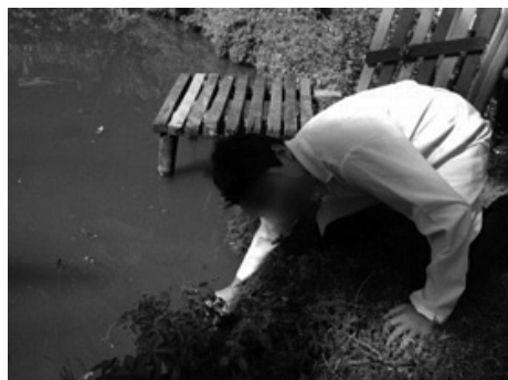
Figura 5: coleta de amostra de água para medir o pH.

lizando indicadores ácido-base, substância que através da coloração indicam se o analito é ácido ou alcalino, identificaram o pH (Potencial Hidrogeniônico) da água. O pH indica a acidez, neutralidade ou alcalinidade de um meio qualquer. Os valores de pH variam de zero (0) a catorze (14) e podem ser medidos por meio de um aparelho denominado pHmetro ou indicadores. Como na escola não possui o aparelho, foi utilizado os seguinte indicadores ácido base: púrpura de metacresol e azul de bromotimol. Com o púrpura de metacresol foi identificado um pH de 7,6 e com o azul de bromotimol, 6,6. Em seguida, foi utilizado o papel indicador que resultou em um pH levemente ácido, 6,0. Assim, a média aritmética dos valores foram calculadas pela expressão: