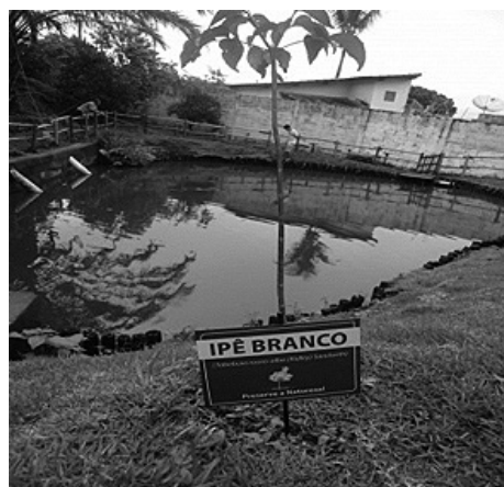
Figura 4: Recomposição da mata ciliar ao redor do lago.

Em seguida, foram coletaram amostras de água, diretamente na fonte (Figura 5). Uti-