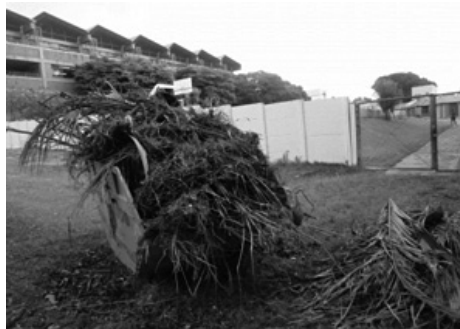
Figura 2: Lixo retirado do lago.

Posteriormente, os alunos realizaram o cálculo da área local, bem como do espaço que necessitava de receber a recomposição da mata ciliar (Figura 3). Salientamos que este tópico vem sendo trabalhado em sala aula de forma expositiva/tradicional na disciplina de matemática. Assim, o trabalho proporcionou o início da aprendizagem de geometria em uma aula de química/ciências utilizando aparatos (trena) concretos, numa abordagem que valoriza o trabalho em equipe e a interação entre os alunos.