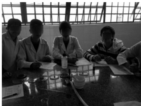
Figura 6: Alunos calculando o pH do solo

pH1= pH da água com o indicador púrpura de metacresol.