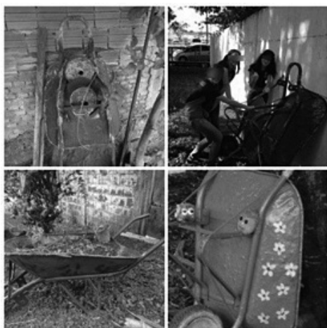
Figura 7: reutilização dos carrinhos para decoração

Posteriormente foi realizado um projeto de paisagismo sobre a decoração que poderia ser realizada no lago e na nascente. O professor-pesquisador do projeto, levou a professora de Artes da escola e os alunos para sugerirem a decoração do ambiente. Inicialmente foi proposto utilizar carrinhos