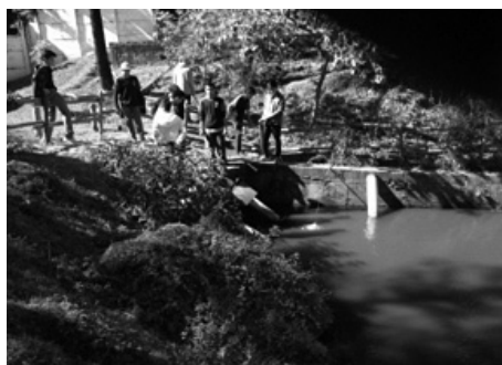
Figura 1: Visita dos alunos até o lago da escola

Nesta etapa, orientou-se os alunos sobre a necessidade do cuidado ambiental com as nascentes. Em seguida, os educandos foram direcionados a investigar os seguintes assuntos: a) Importância de uma nascente para a população; b) Vegetação apropriada para o ambiente; c) Paisagismo sustentável; d) Possíveis testes de