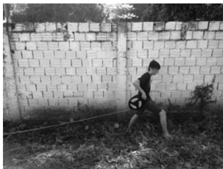
Figura 3: Mesura da área do lago.

Após ser calculada a área do espaço, foi realizado o plantio de árvores, pelo professor e pelos alunos do 9.º ano, ao redor do lago, com a finalidade de impedir o aumento do assoreamento (Figura 4). A mata ciliar é a formação vegetal localizada nas margens do lago. Caso não exista esta mata ciliar, ocorre o fenômeno chamado assoreamento, na qual a erosão das margens leva a terra para dentro do lago (RIZZO, 2007).