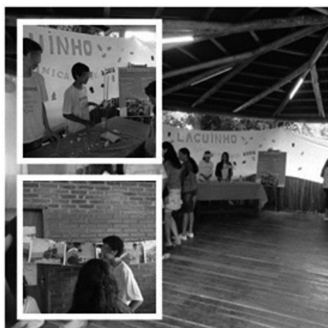
Figura 10: Stand montado pelos alunos para apresentação das atividades para a comunidade escolar.

Após a conclusão do trabalho, os alunos montaram um Stand (Figura 12), na Universidade Federal de Uberlândia, e apresentaram as famílias, amigos, aos funcionários da escola e aos participantes em uma feira de Ciências, denominada Ciência Viva, que essa Universidade organiza, anualmente, para apresentação dos trabalhos dos alunos da educação básica.