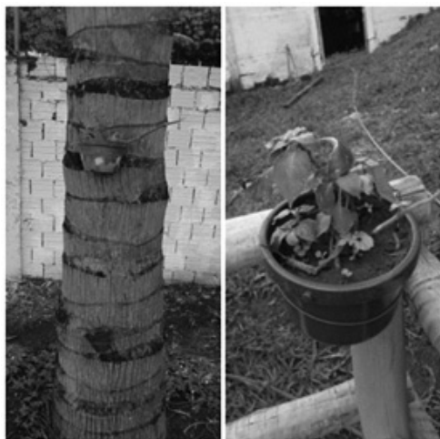
Figura 9: jardim suspenso para decoração

Após a conclusão do trabalho, os alunos montaram um Stand (Figura 12), na Universidade Federal de Uberlândia, e apresentaram as famílias, amigos, aos funcionários da escola e aos participantes em uma feira de Ciências, denominada Ciência Viva, que essa Universidade organiza, anualmente, para apresentação dos trabalhos dos alunos da educação básica.