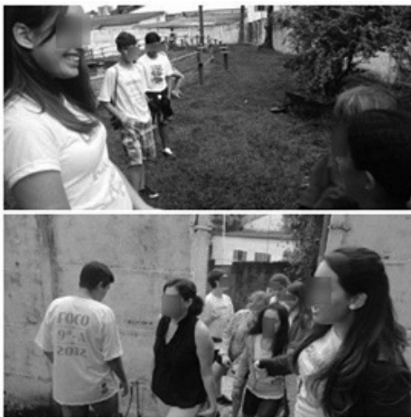
Figura 12: Apresentação dos alunos em uma feira científica na Universidade Federal de Uberlândia.