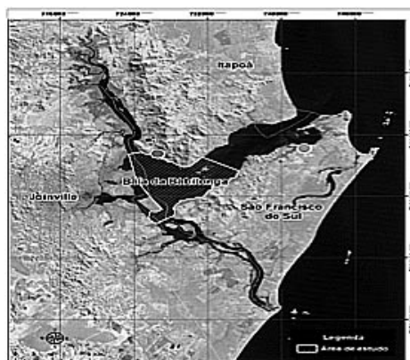
Figura 2: Mapa da Baía da Babitonga, na região destacada com listas a área de habitat das toninhas ( Pontoporia blainvillei ) e o ponto vermelho representa a localização da EEB João Alfredo Moreira.

No que se refere aos passos para o desenvolvimento da investigação, a primeira eta-