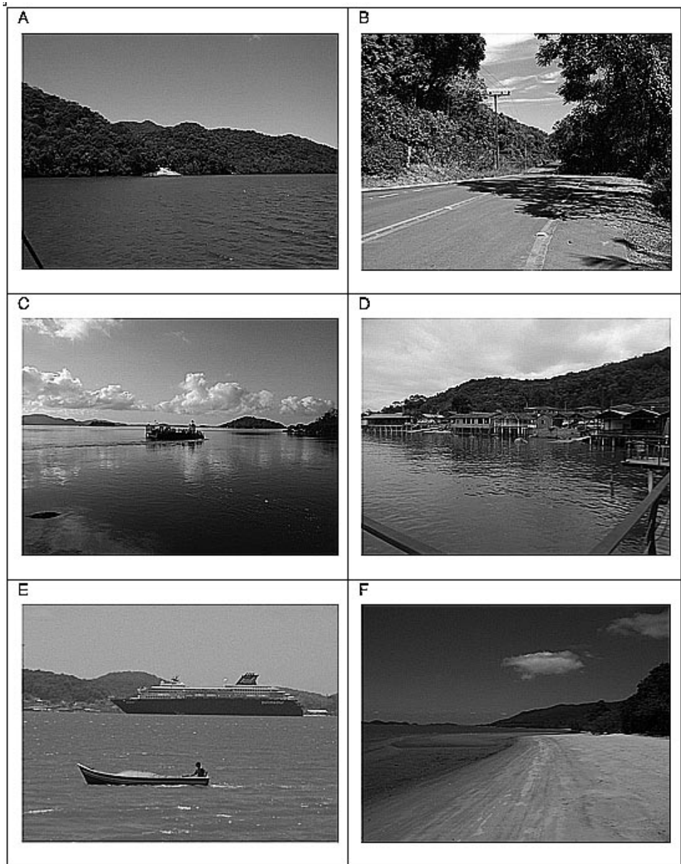
Figura 3 – Imagens da Vila da Glória, registros do primeiro dia em campo : A) vista da balsa da Vigorelli/Joinville onde no meio da mata Atlântica revela-se a estrada que leva para a Vila da Glória; B) a estrada da Vila da Glória, parte pavimentada, cortando a Mata Atlântica; C) A balsa partindo da Vila da Glória para o vilarejo de Laranjeiras, na ilha de São Francisco do Sul; D) região gastronômica da Vila da Glória, especializada em frutos do mar, onde muitos clientes chegam de barco e atracam nos trapiches; E) pescador artesanal da Vila da Glória e ao fundo um navio de cruzeiro transatlântico atracado no porto de São Francisco do Sul; F) praia da Coroazinha, o ambiente marinho e a Mata Atlântica envolvendo a Vila da Glória.