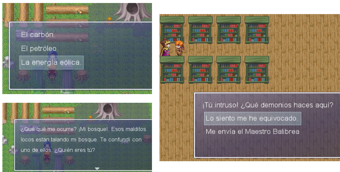
Figura 3. Pantallas del Juego

juego ha sido realizado por uno de los autores del artículo, y se puede descargar gratuitamente desde su página web, www.elmundodepandora.org .