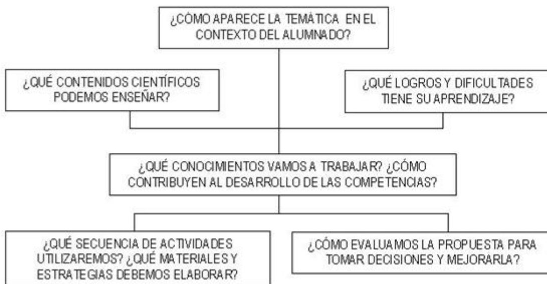
Figura 1. Modelo de Planificación

No obstante, nos centraremos en aspectos singulares de nuestra propuesta: presencia del contenido en el currículo oficial, integración en la programación, la novela como elemento contextualizador, consideraciones metodológicas, relación de posibles actividades prácticas y secuencia de enseñanza y su relación con la web.