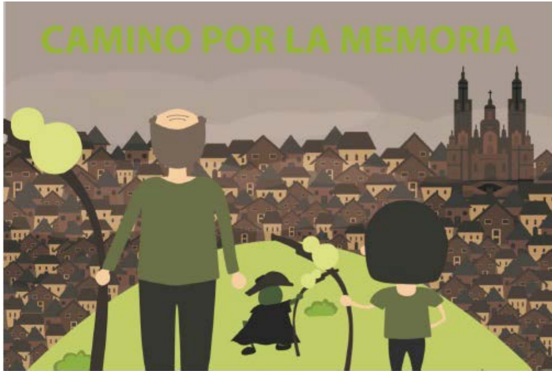
Imaxe 9. Portada do libro.