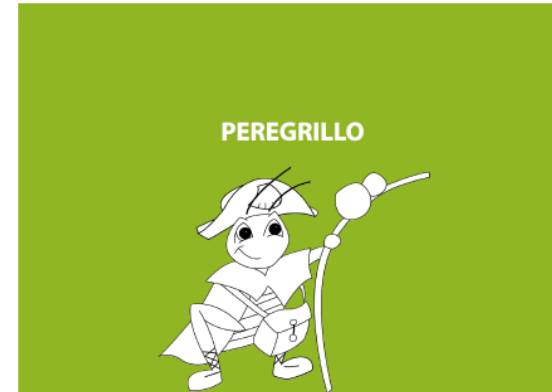
Imaxes 10-11. Maquetación de apartados interiores. Fonte · Portfolio de prácticas das estudantes.

Fonte · Portfolio de prácticas das estudantes.