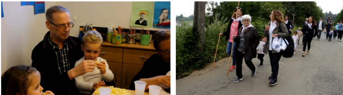
Imaxes 3-4. Fotogramas dos encontros de Camino por la memoria. Fonte · Portfolio de prácticas das estudantes.