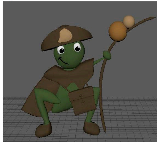
Imaxes 7-8. Peregrillo. Debuxo orixinal e modelado 3D.