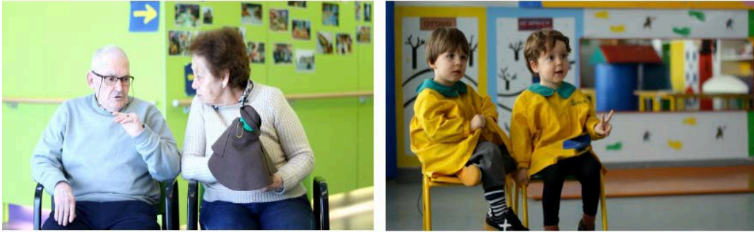
Imaxes 1-2. Fotogramas das entrevistas con avós-nenos participantes.