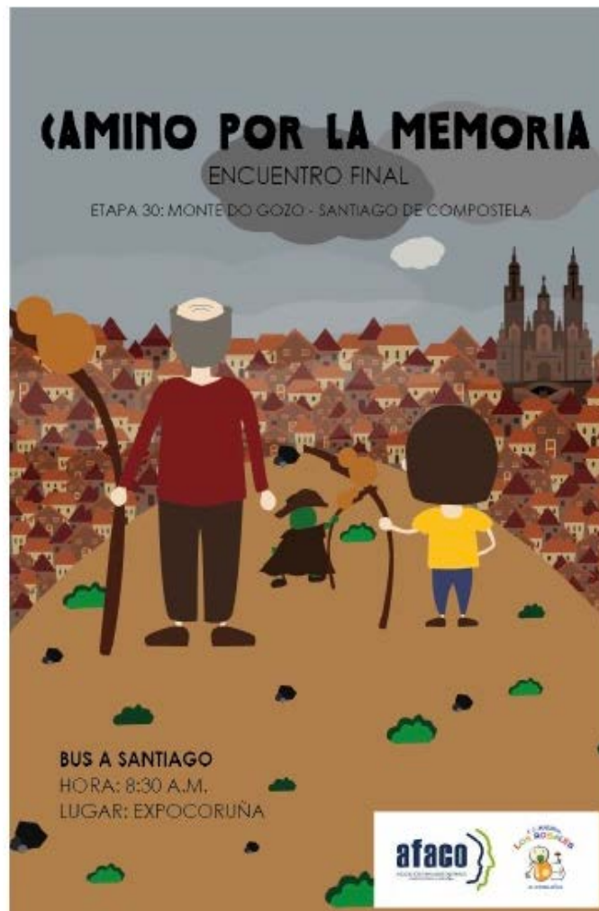
Imaxe 6. Cartel do último encontro do proxecto.