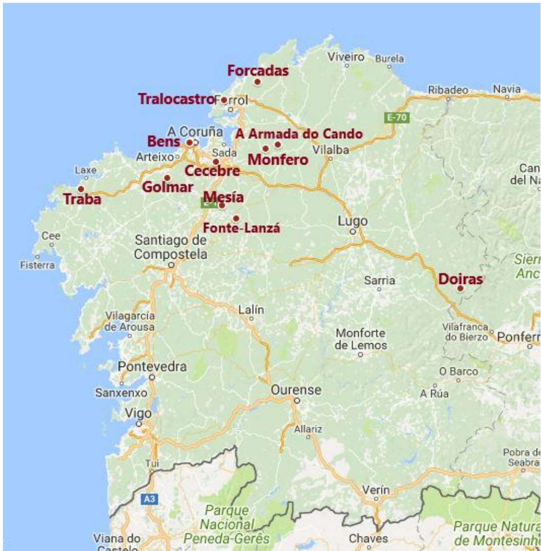
Figura 1: Mapa de Galicia donde se detalla con los puntos rojos la localización de los lugares de recogida de egagrópilas de Tyto alba . Elaborado con Google MyMaps.

Se recurre en algunos casos a muestras de cierta antigüedad a causa del fuerte declive de la lechuza común en Galicia, al igual que en otras zonas de Europa, causado por el abandono del campo (SEO/BirdLife, 2013, 2018). Algunas de las localizaciones de recogida de las muestras actualmente ya no se encuentran habitadas por Tyto alba .