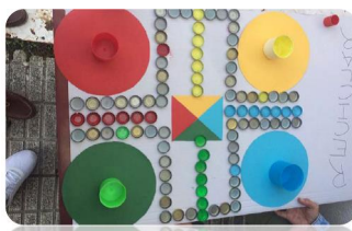
Figura 3. Centro PaiMenni.

No Centro PaiMenni realizáronse actividades relacionadas coa reciclaxe, para o que os estudantes confeccionaron material con cartolina de cores correspondentes ás dos tipos de cubos do lixo (Figura 3).