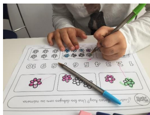
Figura 4. Asociación Down Coruña.

Na Asociación Down Coruña leváronse a cabo actividades de asociación entre grafías de números, conxuntos discretos e cores (Figura 4).