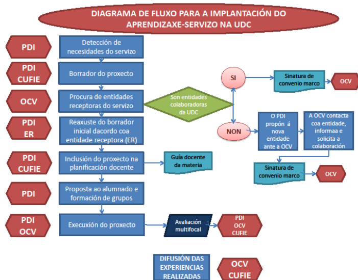
Figura 1. (OCV, 2015)

A nivel académico, o noso obxectivo como docentes é enriquecer a formación dos estudantes de grao coa posta en práctica, en contextos reais, dos contidos académicos traballados nas aulas universitarias. Consideramos que isto contribuirá a que o estudante lle dé significado aos coñecementos teóricos, ao ver a súa utilidade e sentido. Pensamos ademais que este complemento entre a teoría e a práctica, pode preparar ao estudante para a súa futura actividade profesional. Ao fío disto, o traballo en contextos reais incide na capacidade de se adaptar a situacións cambiantes e imprevistas, algo especialmente necesario na profesión de mestre de Educación Primaria. Entón, levar a cabo esta experiencia como parte do proxecto docente da materia pode ter beneficios para a formación do estudante. Adáptase tamén aos obxectivos da materia en canto a competencias que o titulado debe acadar, tal e como figuran no plano de estudos. En concreto incídese de forma efectiva nas seguintes competencias da titulación: