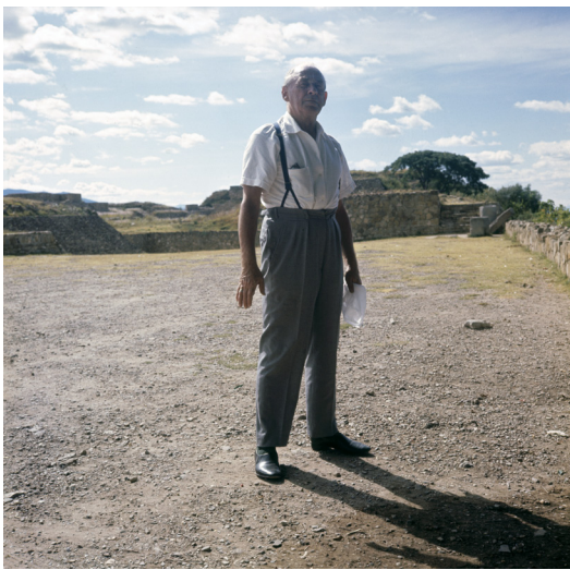
07 Alvar Aalto en la Sala de las columnas en Mitla, Oaxaca 08 Elissa Aalto en la Sala de las columnas en Mitla, Oaxaca 09 Alvar Aalto en Monte Albán, Oaxaca