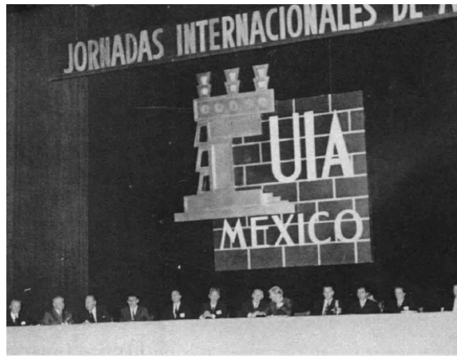
02 Inauguración de las VIII Jornadas Internacionales de Arquitectura en México en 1963