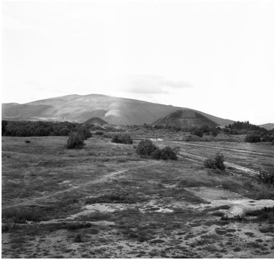
05 Paisaje de Teotihuacán en 1963 (pirámides del Sol y de la Luna) 06 La pirámide del Sol en Teotihuacán