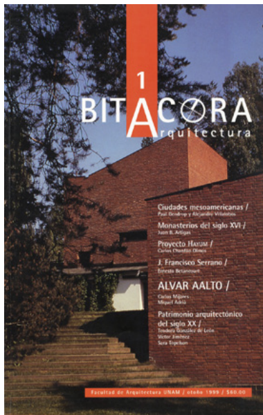
10 Portada del número 1 de la revista mexicana Bitácora Arquitectura