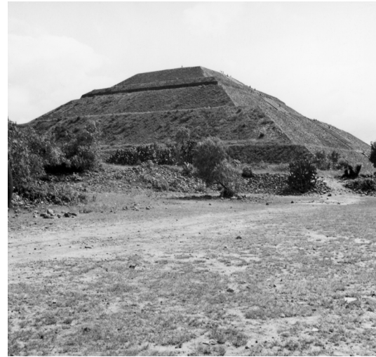
05 Landscape of Teotihuacán by Alvar Aalto in 1963 06 The Pirámide del Sol by Alvar Aalto in 1963

1: Estado de México, con destino principal en Teotihuacán, haciendo escala en Acolman; Ruta 2: Oaxaca, con visitas a Monte Albán y Mitla; y Ruta 3: Acapulco, aunque no necesariamente en ese orden. Varias fotografías realizadas por ellos mismos dan testimonio de estas excursiones en territorio mexicano.