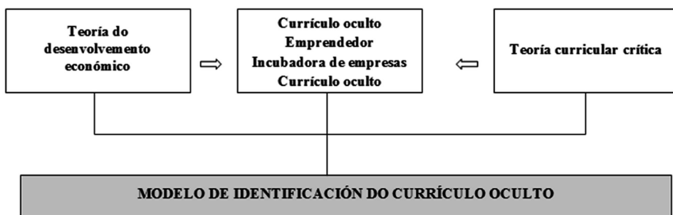
Figura 2. Teorías do modelo de identificación do currículo oculto

Espérase que esta pescuda sirva para desenvolver outros métodos para seren utilizados en estudos máis profundos sobre o currículo oculto. O referencial teórico que sustenta o modelo de identificación do currículo oculto móstrase na Figura 2.