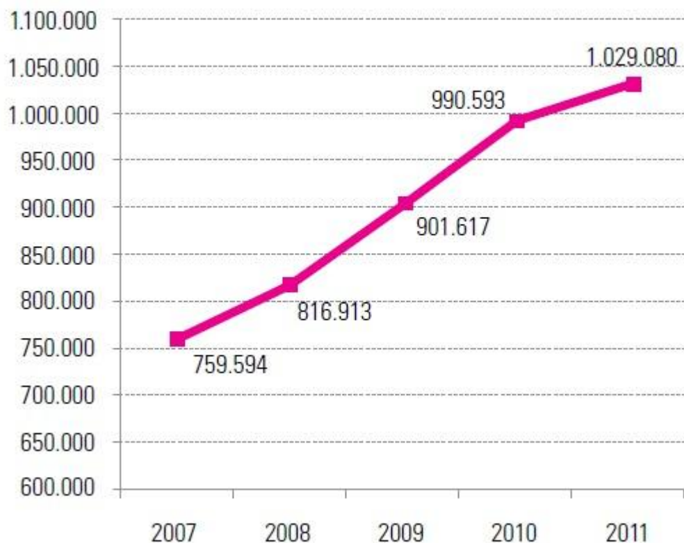
GRÁFICO 1. Evolución 2007-2011 del número de prestaciones por hijo a cargo de la S. Social