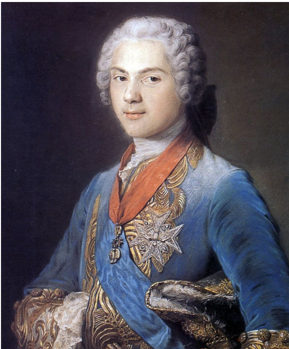
Luis de Francia, Delfin (1745), por Maurice Quentin de La Tour