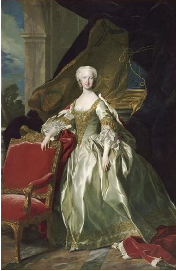
María Teresa Rafaela de Borbón, (1743) por Louis-Michel van Loo