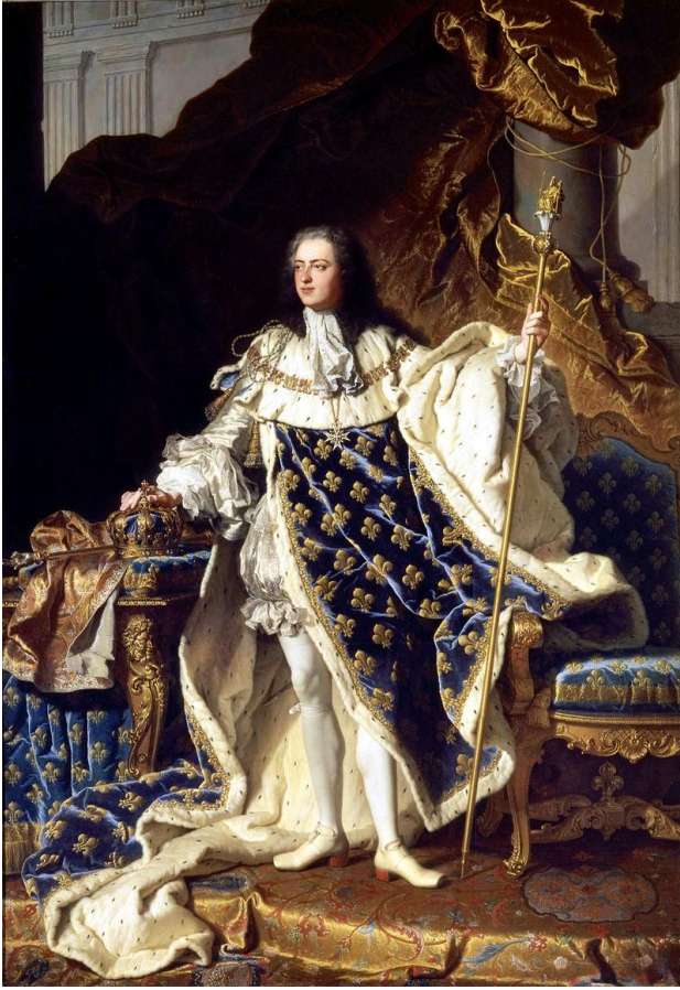
Luis XV de Francia (1748), por Maurice Quentin de la Tour