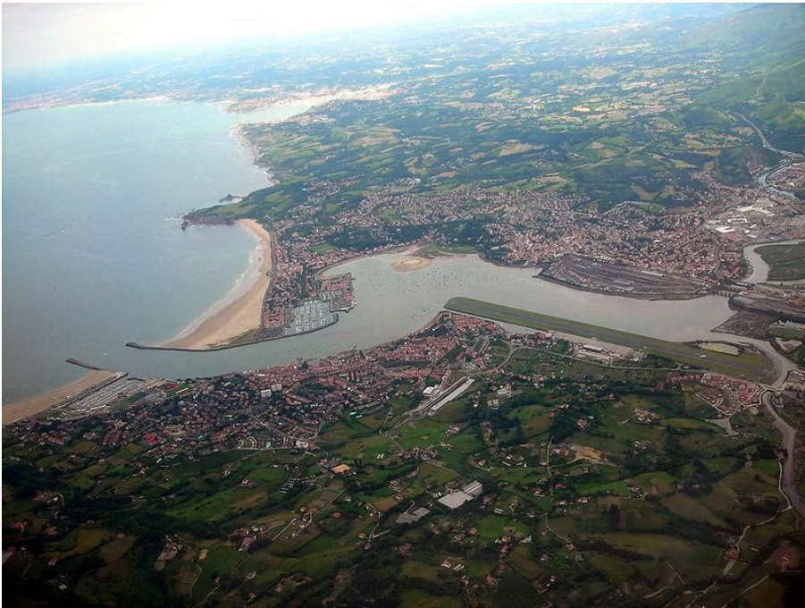
Vista aérea de Fuenterrabía y Hendaya, partidas por el río Bidasoa, frontera de España y Francia.