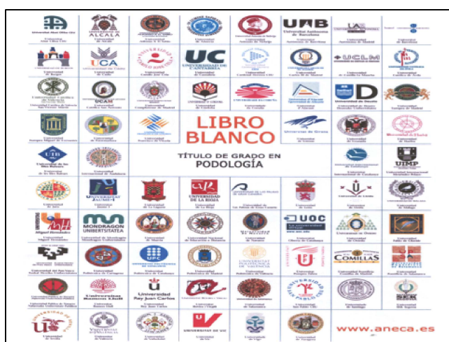
Figura 6.- Libro Blanco del Título de Grado en Podología, 2.005

El informe presentado por las nueve Universidades españolas que impartían la titulación de Diplomado en Podología, en el marco de la Segunda Convocatoria de Ayudas para el Diseño de Planes de Estudio y Títulos de Grado de la Agencia Nacional de Evaluación de la Calidad y Acreditación (ANECA), fue aprobado por la Comisión de Evaluación del diseño del título de grado y recomendó su publicación, que se hizo, con la denominación de “ Libro Blanco del título de Grado en Podología ”, en julio de 2.005 (8).