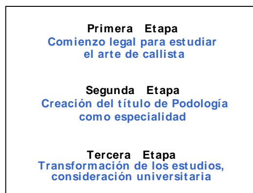
Figura 1.- Etapas de los estudios de Podología en España

El objetivo de esta clasificación es trazar un panorama general, a modo de encuadre del artículo, de la historia de los estudios de Podología referido solamente al ámbito español. Sin ánimo, ni mucho menos, de exhaustividad, la clasificación de las tres etapas se realiza con el objetivo de repasar un conjunto de acontecimientos fundamentales (1-4).