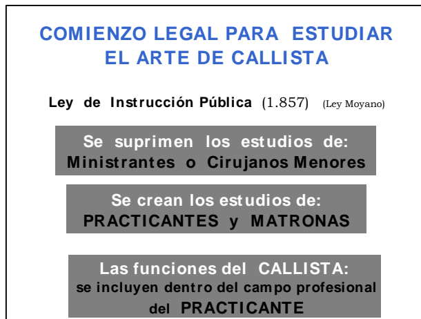
Figura 2.- Primera etapa de los estudios de Podología en España. Leyes y acontecimientos destacados

En 1.888 se regula de nuevo el ejercicio de Practicantes y Matronas. Se establece que el Practicante en Medicina y Cirugía continuará ejerciendo las pequeñas operaciones de la denominada "cirugía menor", previamente ordenadas por los Licenciados o Doctores de Medicina.