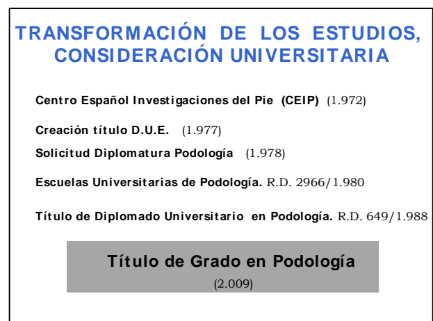
Figura 4.- Tercera etapa de los estudios de Podología en España. Acontecimientos destacados

En 1.977 se aprueba el Real Decreto 2128/1977 sobre integración en la Universidad de las Escuelas de Ayudantes Técnicos Sanitarios como Escuelas Universitarias de Enfermería, recibiendo las nuevas promociones el Título de Diplomado Universitario en Enfermería.