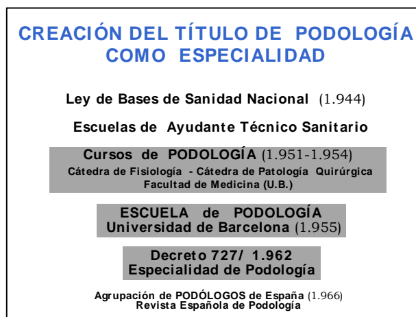
Figura 3.- Segunda etapa de los estudios de Podología en España. Leyes y acontecimientos destacados

De conformidad con lo dispuesto en el artículo 23 de la Ley de Ordenación Universitaria vigente, a propuesta de la Facultad de Medicina de la Universidad de Barcelona, y previo informe de la Comisión Central de los estudios de Ayudantes Técnicos Sanitarios y del Consejo Nacional de Educación, por Orden Ministerial publicada en 1.955, se crea la Escuela de Podología de la Universidad de Barcelona, adscrita a la Facultad de Medicina, que impartió cursos de especialización sobre enfermedades de los pies a aquellos practicantes que ejercían como cirujanos-callistas, a través de una Sección del Dispensario de Ortopedia adscrita al Servicio de Patología Quirúrgica "A" de dicho Centro y Universidad. Fue la primera vez que apareció la palabra “Podología” en un documento oficial.