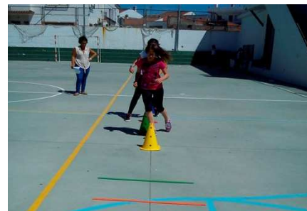
Figura 7: Mini-circuito en Zig-Zag.