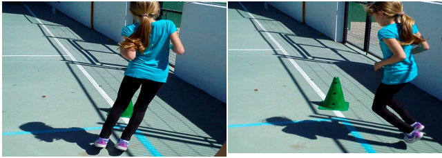
Figuras 8 y 9. Salto con los pies juntos.

Una vez realizados los ejercicios, se pasó el Pictorial Children's Effort Rating Table (en adelante PCERT) (21) para que puntuaran en la escala numérica del 1 al 10 su percepción del cansancio.