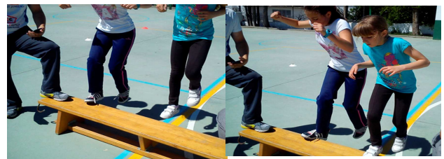
Figuras 5 y 6. Alternancia de piernas en banco sueco.