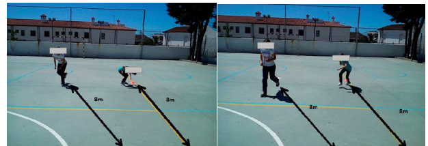
Figuras 3 y 4. Desplazamientos tocando líneas a 8 m de distancia.