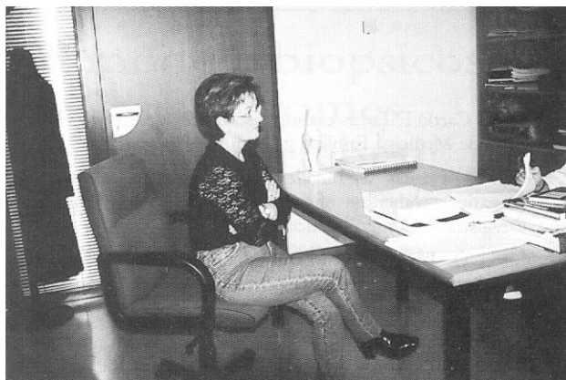
Figura 5. Taparse la boca de forma constante puede significar no estar de acuerdo con el comunicante o estar interesado en la conversación