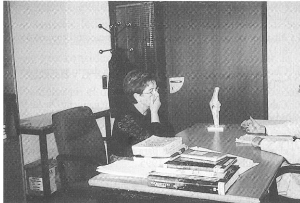
Figura 6. Brazos y piernas cruzados indican una actitud defensiva, de resistencia