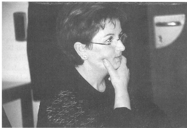
Figura 4. Acariciarse la barbilla o mano apoyada en el mentón muestra un signo de interés y atención

Se deben evitar gestos como el de apoyar la cabeza sobre la mano, ya que transmiten una imagen de aburrimiento. También es conveniente prestar atención a los gestos del consultante (22, 26, 27) (Figs. 4, 5 y 6).