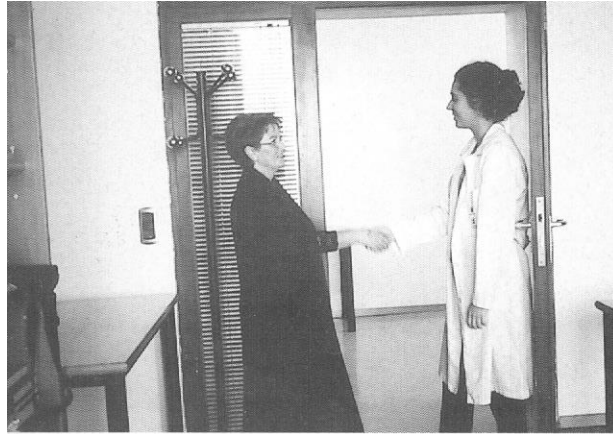
Figura 1. Presentación correcta

La forma de tratamiento puede ser de tú o de usted en función del conocimiento previo que tengamos de la persona, su edad, la situación, etc.