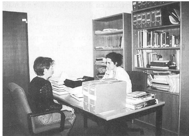
Figura 2. Barreras físicas a la comunicación

La consulta debe tener la amplitud suficiente y estar decorada de manera adecuada sabiendo que es una rica fuente de información (14, 22), pero sin caer en el barroquismo. Se deben evitar las barreras físicas. Por ejemplo, la mesa no debe dificultar el proceso comunicativo, de tal modo que tenemos que tener todo ordenado y despejado (Fig. 2) y disponer de todo el material necesario para realizar la entrevista sin tener que interrumpirla para ir a buscarlo (23, 25). También hay que manejar con corrección las interrupciones telefónicas (9, 26). Se debe hacer notar que se está ocupado y posponer el contacto telefónico. Si no se hace se corta drásticamente la comunicación y es difícil después reestablecerla (24).